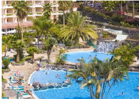
Blick von Ihrem Hotel auf den Pool

Das 4-Sterne Hotel Puerto Palace befindet sich in Puerto de la Cruz im Norden Teneriffas. Von Ihrem Hotel haben Sie einen herrlichem Blick auf das Orotava-Tal, den Teide und den Atlantik. Restaurants, Einkaufs- und Freizeitmöglichkeiten sind in direkter Nähe. Das gemütliche und familiäre Hotel ist seit zwei Generationen unter deutscher Leitung und bietet Ihnen das perfekte Ambiente für Ihren Aufenthalt auf Teneriffa. Die charmant eingerichteten Zimmer verfügen über einen Balkon und einen Minikühlschrank.