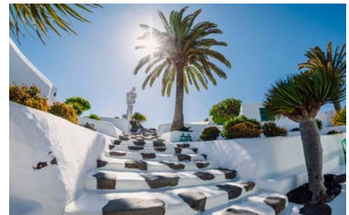
Museo del Campesino auf Lanzarote

Was für eine Insel der Gegensätze! Kilometerlange, weißsandige Strände, voller farbenfroher Tupfer von jenen. Das Surferparadies Fuerteventura wird Sie mit vielen verschiedenen Facetten begeistern. Dementsprechend ist auch das vom Passatwind geschliffene, sandfarbene Hügelland im Inneren der Insel geprägt von weiß getünchten Windmühlen und uralten, aber intakten Wasserschöpfprädern, die der kargen Wüstenlandschaft immer wieder grüne Oasen voll überbordender Fruchtbarkeit abtrotzen. Entdecken Sie die Insel für sich und probieren Sie unbedingt den typischen Käse und ein Glas Sangria.