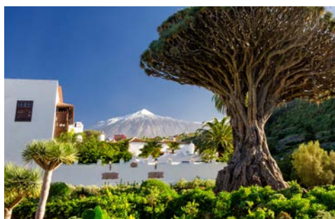
Blick auf den Teide

Nach der Ausschiffung erfolgt der Transfer und der Rückflug zum gebuchten Flughafen.