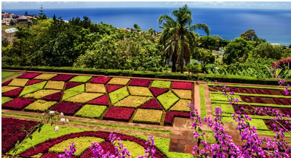
Der Botanische Garten in Funchal, Madeira

Bereits im Jahre 1970 entstanden die Pläne des Gartens, doch erst neunzehn Jahre später konnte er ihn endlich im Auftrag der Inselregierung realisieren. Im Norden der Insel hat er in einem einzigartigen, zusammenhängenden Höhlensystem vulkanischen Ursprungs, den Jameos del Agua, ein Zentrum für Kunst und Kultur geschaffen. Kernstück dieser unterirdischen Anlage ist ein Konzertsaal mit etwa 600 Sitzplätzen. Warum machen Sie sich nicht ein Bild von Manriques fantasievollen Kunstwerken, die sich harmonisch in die Natur einfügen?