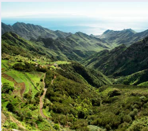
Anagaberge auf Teneriffa