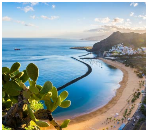
Palmenstrand Las Teresitas