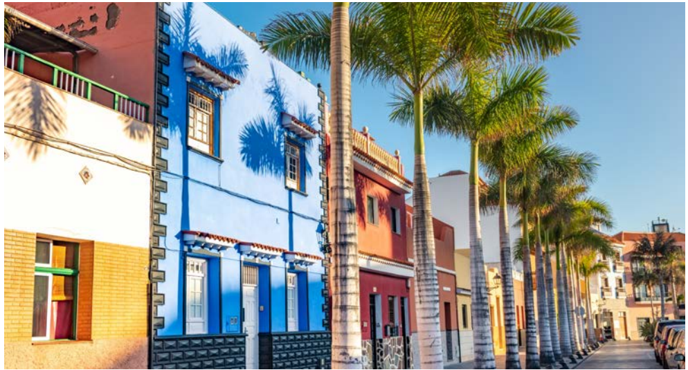
Teneriffa – Puerto de la Cruz

Freuen Sie sich auf eine beeindruckende Reisekombination: Zunächst erleben Sie erholsame Tage in Puerto de la Cruz auf Teneriffa in einem charmanten 4-Sterne Hotel am Atlantik. Mit dem Ganztagesausflug erleben Sie die Inselattraktionen Teneriffas inklusive Tapas Snack. Als nächstes wartet eine abwechslungsreiche Kreuzfahrt mit unvergesslichen Erlebnissen auf Sie: Die Prunkstücke der Kanaren wollen von Ihnen entdeckt werden. Dabei lacht Ihnen die Sonne zu, das Meer wiegt Sie sanft auf Ihrer Sonnenliege oder in Ihrer komfortablen Kabine in den Schlaf. Es wartet eine paradiesische Natur auf Sie mit wunderschönen Stränden und Buchten, zauberhaften Städten sowie einer einmaligen Vegetation. Langeweile kommt auf AIDAcosma garantiert nicht auf, wenn Sie das abwechslungsreiche Showprogramm im Theatrium oder die verschiedenen Sport- und Wellnessangebote wahrnehmen.