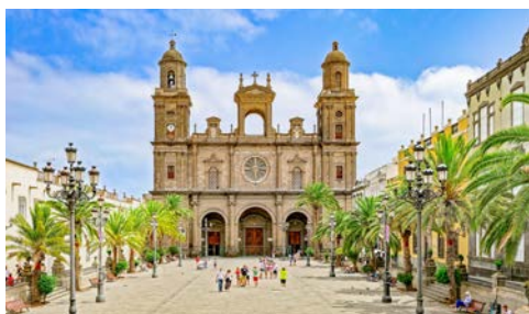
Kathedrale Santa Ana in Las Palmas

Bereits im Jahre 1970 entstanden die Pläne des Gartens, doch erst neunzehn Jahre später konnte er ihn endlich im Auftrag der Inselregierung realisieren. Im Norden der Insel hat er in einem einzigartigen, zusammenhängenden Höhlensystem vulkanischen Ursprungs, den Jameos del Agua, ein Zentrum für Kunst und Kultur geschaffen. Kernstück dieser unterirdischen Anlage ist ein Konzertsaal mit etwa 600 Sitzplätzen. Warum machen Sie sich nicht ein Bild von Manriques fantasievollen Kunstwerken, die sich harmonisch in die Natur einfügen?