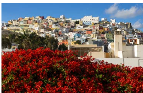
Wunderschönes Las Palmas

Von allen Urlaubsfreuden etwas, das bietet Ihnen die kreisrunde und wohl bekannteste Kanareninsel Gran Canaria. Den Westen der Insel kennzeichnen hohe Gebirge und tiefe Canyons. Sehenswert ist auch die Hauptstadt Las Palmas, die mit Einkaufsstraßen, Stadtparks und historischen Bauwerken schon immer eine kulturelle Brücke zum europäischen Festland war. Die über die Insel hinaus bekannte, vom Wind herbei gewehrte Miniwüste von Maspalomas sowie deren sonnenverwöhnte Dünenlandschaft und das strahlend blaue Wasser machen jedem Besucher klar: Gran Canaria, das ist ganzjährig herrliches, atlantisch erfrischendes Badevergnügen.