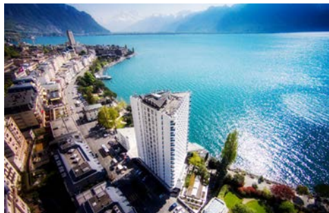
Direkt am Ufer – Eurotel Montreux