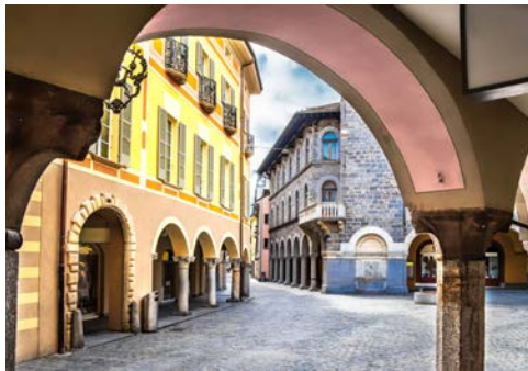
Wunderschöne Arkaden in Bellinzona