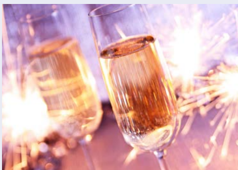
Stoßen Sie auf das neue Jahr 2025 an!

Nach einem gemütlichen Frühstück fahren Sie an den Comer See, mit bis zu 400 m Tiefe ist er der tiefste Alpensee. Vorbei an herrschaftlichen Villen und prächtigen Sommerresidenzen, die in weiß und gelb durch die subtropische Fauna der Parks schimmern, gelangen Sie zur Villa Carlotta, einem 1747 errichteten Palazzo. Über eine Doppelterrasse, die sich über fünf ansteigende Terrassen erstreckt, erreichen Sie die repräsentativen Innenräume. Die Villa verdankt ihren Namen der Tochter von Prinzessin Marieanne von Preußen, Charlotte, die für Botanik und