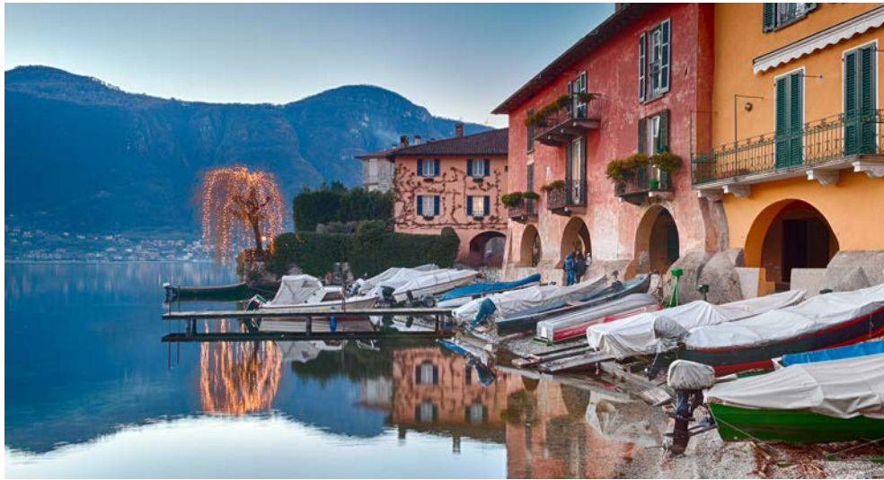
Italienischer Charme am Comer See