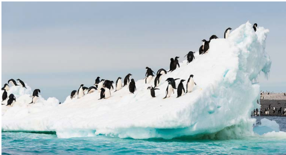
Pinguine in der Antarktis