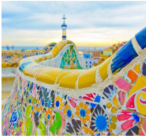
Park Güell in Barcelona

Entdecken Sie die landschaftliche Vielfalt und Schönheit Mallorcas: Schwindel erregende Felsküsten, mächtige Berge, knorrige Olivenbäume und duftende Zitronen- und Orangenhaine. In Palma de Mallorca, der lebendigen Hauptstadt der spanischen Insel, finden Sie unzählige Kultur- und Unterhaltungsangebote. Palmas Wahrzeichen ist die beeindruckende Kathedralenkirche „La Seu“ aus dem 13. Jahrhundert. Auch das Castillo Bellver, hoch über der Stadt gelegen, lohnt einen Besuch.