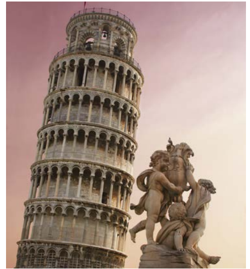
Der schiefe Turm von Pisa – einen Besuch wert

Gesundheitshinweise: Sämtliche Informationen und Hinweise erhalten Sie im Internet unter der unten angegebenen Adresse. Hinweis zur Barrierefreiheit: Unser Angebot ist für Reisende mit eingeschränkter Mobilität nur bedingt