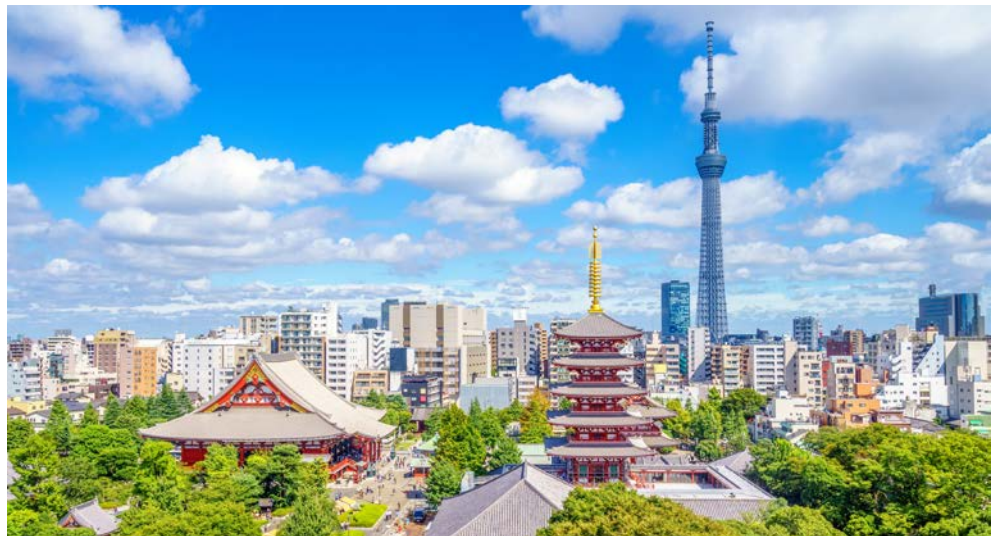
Die Skyline von Tokio