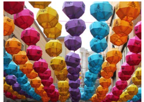
Straßenschmuck in Südkorea

Nach der Ausschiffung Transfer zum Flughafen und Rückflug nach Deutschland.