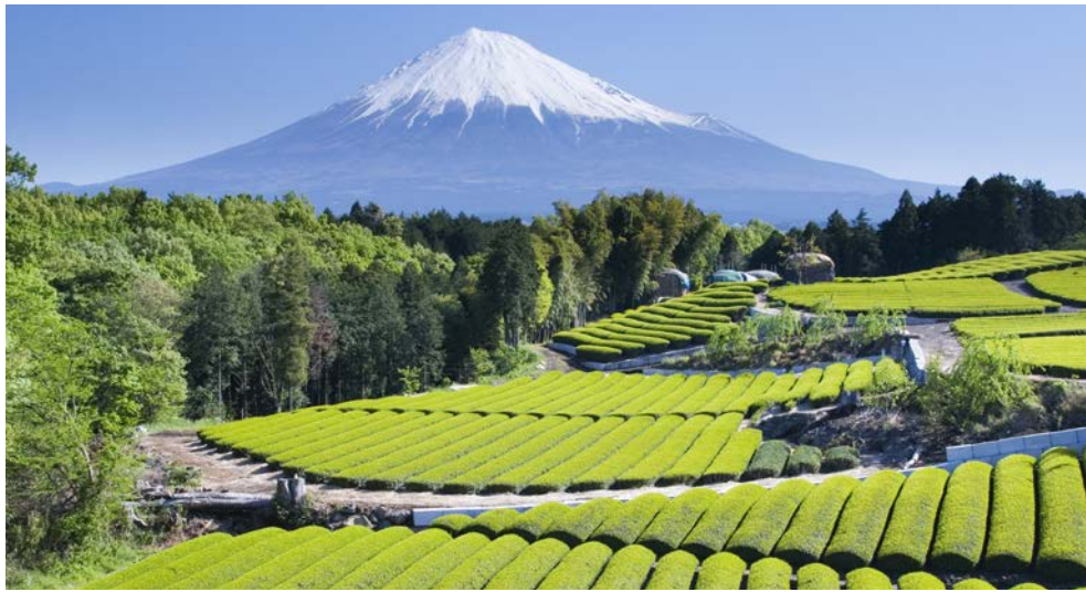
Der Vulkan Fuji