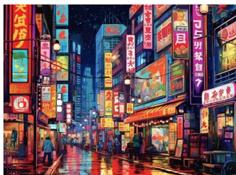
Nächtliches Lichtermeer in Tokio

Nach dem Frühstück im Hotel fahren Sie in den Stadtteil Asakusa. Hier wird mit den traditionellen Kunsthandwerksläden und Imbissbuden in der Nakamise Street die Atmosphäre eines Tokios vergangener Zeiten bewahrt. Das Viertel ist übersät mit zwanglosen Izakaya-Kneipen sowie Yakitori-Restaurants, in denen typische Spezialitäten angeboten werden. Hier finden Sie auch den antiken buddhistischen Tempel Senso-ji, den ältesten und bedeutendsten Tempel Tokios. Weiter geht es zum Tokyo Skytree. Wer möchte, kann die atemberaubende Aussicht auf die Stadt genießen (Auffahrt nicht inklusive, ca. € 30,- p.P., zahlbar vor Ort), ein paar Souvenirs erstehen oder eine kleine Mittagspause einlegen. Am Nachmittag erreichen Sie den Hafen von Yokohama, wo die DIAMOND PRINCESS Sie zur Einschiffung erwartet.