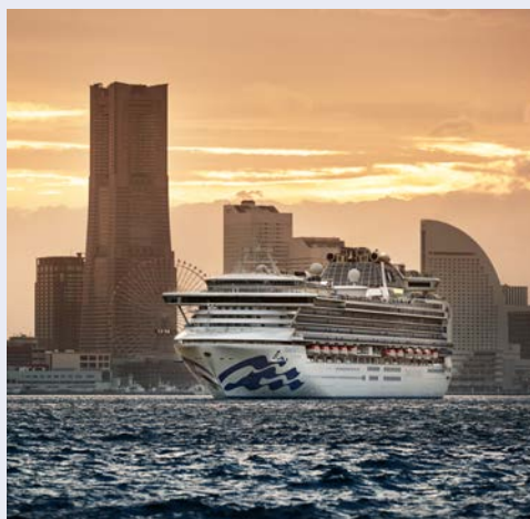
Die DIAMOND PRINCESS vor Yokohama