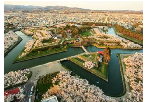
Blick auf den „Stern“ von Hakodate

Der großartige Osten Hokkaidos besitzt einige der ursprünglichsten Landschaften und Wildtierlebensräume in Japan. Diese weitläufige und abgeschiedene Ecke Japans beherbergt drei der sechs Nationalparks Hokkaidos und lohnt das ganze Jahr über einen Besuch. Die atemberaubende Landschaft der Nationalparks Akan-Mashu und Shiretokowid Sie begeistern.