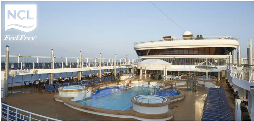
Auf dem Pooldeck der NORWEGIAN STAR