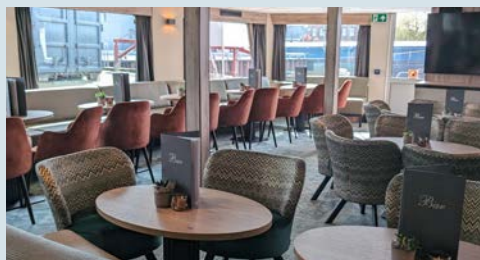
Neu gestaltete Lounge an Bord

Zusätzlich vorab buchbar: Elektrofahrrad* Aufpreis € 110,- (nur gegen Voranmeldung, begrenzte Anzahl)