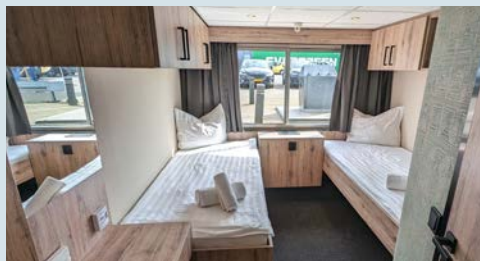
Kabinenbeispiel auf dem Oberdeck