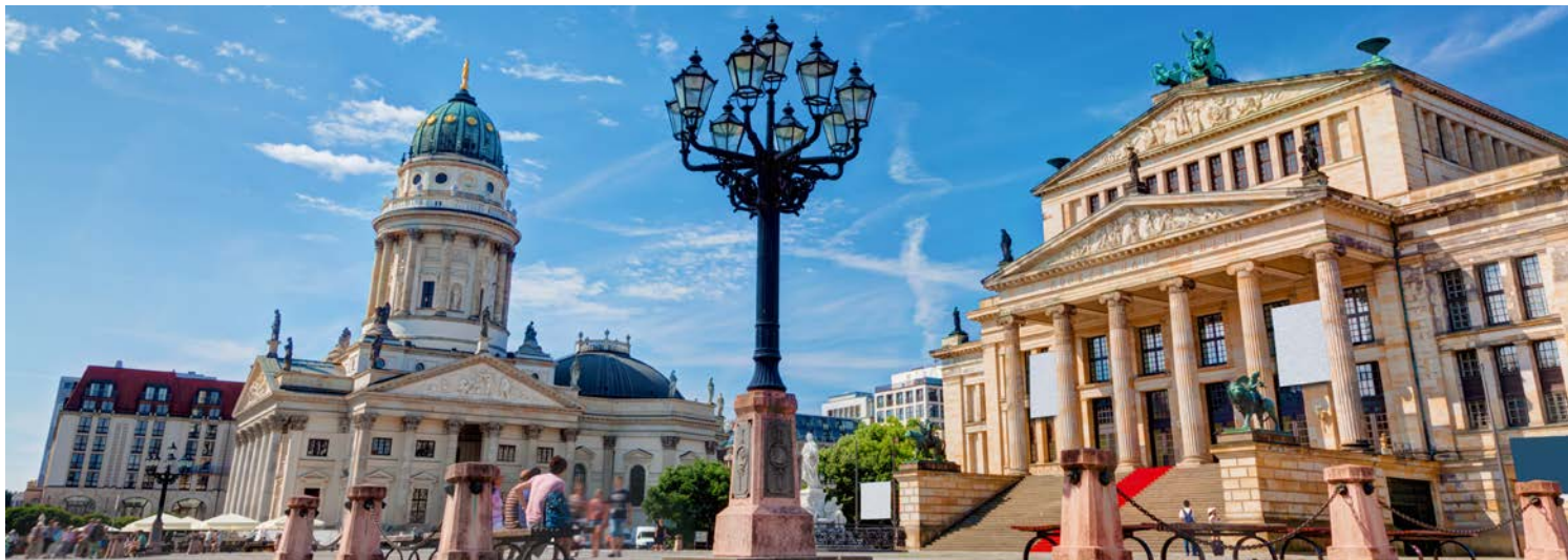
Unverkennbar – der Gendarmenmarkt in Berlin