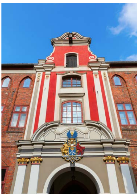
Barockschloss in Oranienburg