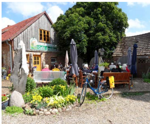
Eine kurze Pause zwischendurch

Nach einer letzten engen Durchfahrt gelangt die PRINCESS auf die weitläufige Wasserfläche des Stettiner Haffs (Oderhaff). Nach der Durchquerung erreichen Sie Wolgast, das „Tor zur Insel Usedom“. Sehenswert ist auf jeden Fall die mittelalterliche Altstadt mit Rathaus und Petrikirche.