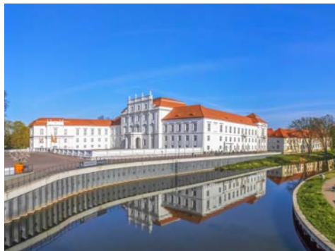
Barockschloss in Oranienburg

Durch das Ruppiner Seengebiet führt der gut ausgebaute Radweg Richtung Norden nach Oranienburg. Absolut sehenswert ist hier das Barockschloss mit Park, Museum und Orangerie. Hier gehen Sie wieder an Bord und fahren bis nach Eberswalde. Im Herzen der Stadt, im Finowkanal, befindet sich die älteste betriebsfähige Schleuse Deutschlands, die seit 1978 ein technisches Denkmal ist.