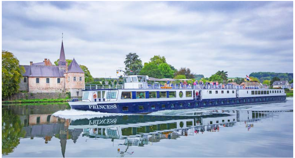
Die PRINCESS erwartet Sie

Von der Weltstadt Berlin mit ihren ausgedehnten Wäldern im Norden fahren Sie zuerst auf dem Oder-Havel-Kanal über Oranienburg und Eberswalde nach Schwedt. Die ruhige und einzigartige Schönheit der Oder-Landschaft begleitet Sie bis ins polnische Stettin mit dem prachtvollen Schloss. Ihr Weg führt Sie dann entlang der einzigartigen Boddenküste über Usedom zur größten Insel Deutschlands, nach Rügen, mit ihrem berühmten Kreidefelsen. Ziel und Endpunkt Ihrer Reise ist die alte Hansestadt Stralsund. Was kann wohl schöner sein als auf Radtouren viel Interessantes über Land und Leute, Kultur und Natur zu erfahren und im Anschluss wieder auf Ihr „schwimmendes Hotel“ zu gehen? Entdecken Sie die vielfältige Flora und Fauna dieser einzigartigen Flusslandschaften, barocke Schlösser, Backsteingotik und norddeutsche Bäderarchitektur.