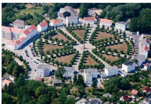
Der „Circus“ in Putbus

Morgens radeln Sie über Zecherin, Karlshagen-Hafen nach Peenemünde, wo Sie sich das Historisch-Technische Museum im ehemaligen Kraftwerk ansehen sollten. Bei schönem Wetter lohnt auch die etwas längere „Strandroute“ über Zinnowitz und Trassenheide. Abends fahren Sie mit der PRINCESS nach Lauterbach im Südosten der Insel Rügen.