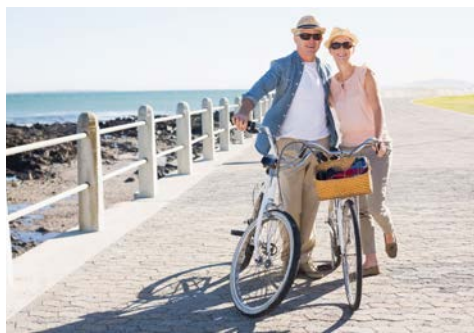
Ihre Radtour kann beginnen

Programmänderungen bedingt durch Wartezeiten an Schleusen, Wasserstände, Gezeiten und anderer navigatorischer Umstände bleiben vorbehalten.