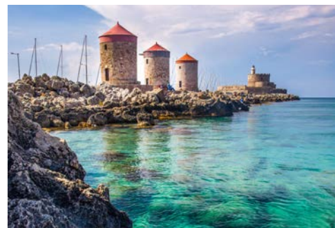
Hafeneinfahrt von Rhodos Stadt