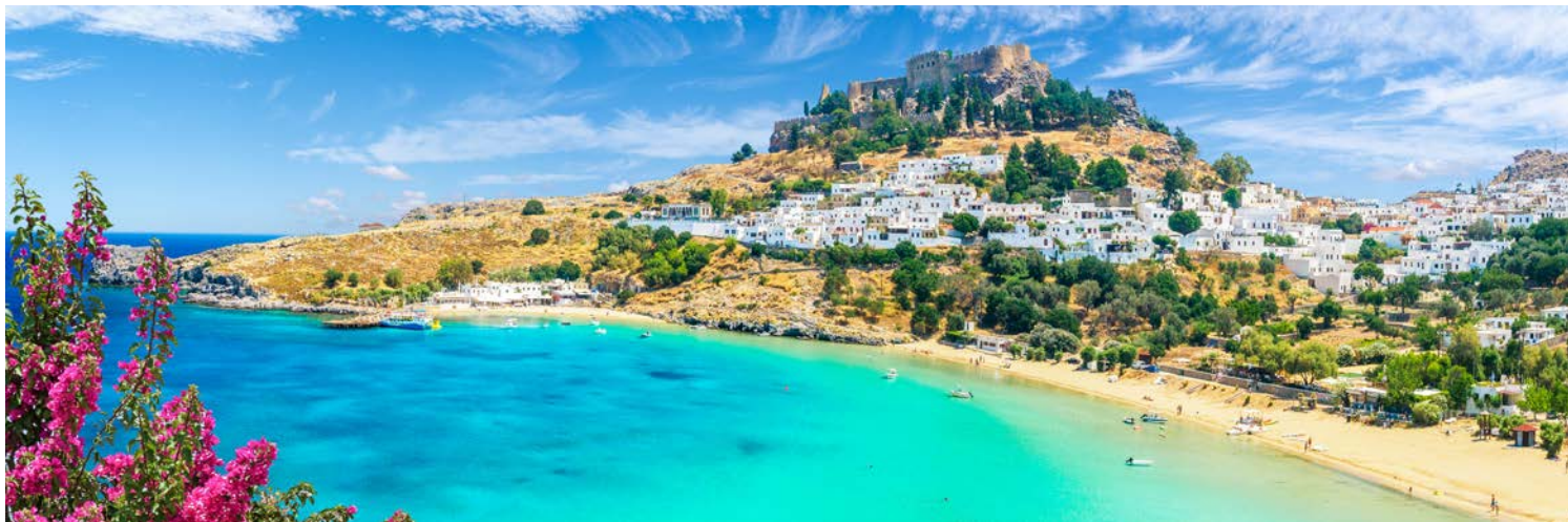
Blick auf die weiße Stadt Lindos