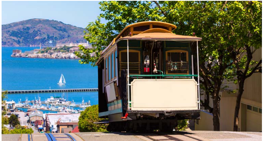
San Francisco - unternehmen Sie eine Fahrt mit der berühmten CableCar!

Wenn Träume reisen ... Dann sind sie wohl bei uns angekommen! Wer etwas ganz Besonderes erleben möchte, wer schon immer davon geträumt hat, unsere riesige und so fantastische Welt zu erkunden, der ist auf dieser exklusiven Sonderreise genau richtig. „Round the World“ mit der unglaublich vielfältigen OVATION OF THE SEAS ist die Erfüllung eines Lebenstraums. Die Stadt der Golden Gate Bridge, San Francisco, ist wunderschöner Auftakt Ihrer Reise – Komforthotel, Stadtrundfahrt ... saugen Sie diese ganz besondere Atmosphäre in sich auf. Ein lebensfrohes und buntes „Aloha“ begegnet Ihnen dann in Honolulu – Hawaii, der Inbegriff paradiesischer Träume, wartet auf Sie. Damit nicht genug, heißt es dann „Willkommen an Bord eines der innovativsten Schiffe der Welt“. Die OVATION OF THE SEAS ist so viel mehr als ein Schiff. Mit ihr gleiten Sie durch den Südpazifik zu den Perlen Französisch-Polynesien, über Neuseeland bis nach Australien. Sydney empfängt Sie zu einem krönenden Nachprogramm – natürlich inklusive Privatführung im berühmten Opernhaus!