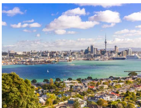
Blick auf Auckland

Im Vitality Spa finden Sie die perfekte Entspannung und alles, was das Wellness-Herz begehrt. Shopping-Freunde kommen in zahlreichen exklusiven Geschäften auf ihre Kosten und das Showprogramm an Bord lässt ebenfalls keine Wünsche offen. Atemberaubende Akrobatik, eine elektrisierende Choreografie, aufwendige Kostüme und hypnotisierende visuelle Effekte. Zwischendurch vielleicht ein Tanzkurs, ein Cocktail an der Bar, schlemmen als gäbe es kein Morgen, eine Runde im Pool schwimmen ... Dieses Schiff ist ein Schlaraffenland!