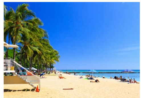
Besuchen Sie die Traumstrände Honolulus

trockene Westküste teilweise einen wüstenartigen Charakter hat, gibt es auf der Nord- und Ostseite eine üppige Vegetation mit Ananas, Papaya, Kakao und anderen Agrarprodukten. Die Strände der Insel sind zahlreich und vielfältig – eines aber haben sie alle gemeinsam: Sie ziehen Strandliebhaber und Wellenreiter aus der ganzen Welt an. Der Waikiki-Strand ist sogar einen der berühmtesten Strände der Welt. Wunderschön ist auch der Waimea Falls Park, ein botanischer Garten mit dem einzigen leicht zugänglichen Wasserfall der Insel. In eine Plantagenlandschaft eingebettet, findet man das Polynesian Cultural Center mit nachgebauten Minidörfern aus sieben Südseeregionen. Die perfekte Kulisse für Shows mit traditioneller Kultur und Handwerk. Im Valley of the Temples befinden sich Gotteshäuser verschiedener Religionen. Sie sehen, Oahu ist eine fantastisch vielfältige Insel – da kommt eine ganztägige Inselrundfahrt doch genau richtig!