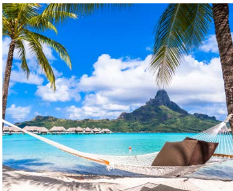
Das Paradies erwartet Sie auf Französisch-Polynesien!

Raiatea bedeutet so viel wie „ferner Himmel“ und ist eine Insel von beeindruckender Schönheit. Hier stoßen Sie auf alte Mythen und den größten Außentempel (Marae) Französisch-Polynesiens. Raiatea liegt in einer ruhigen Lagune und ist von einem Korallenriff, in dem es von buntem Leben nur so wimmelt, umgeben – ideal zum Schnorcheln und Tauchen.