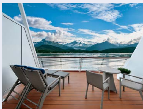
Herrliche Aussicht vom Balkon aus (Beispiel)