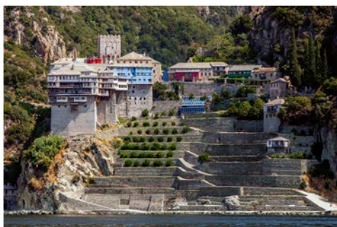
Autonome Mönchsrepublik Athos

Frühstück im Hotel. Heute könnten Sie – wenn Sie mögen – bei ruhiger See eine herrliche Schiffsfahrt zum Berg Athos unternehmen. Die Reise geht entlang der Südspitze dieser Halbinsel in die Mönchsrepublik Athos. In diesem nur von Mönchen bewohnten Gebiet stehen bereits seit dem 7. Jh. etwa 20 Klöster. Hier führen in der einsamen Bergwelt griechisch-orthodoxe Mönche ein abgeschiedenes, asketisches Dasein. Das Schiff bringt Sie zum Hafen von Ouranoupolis, wo Sie nach einem kleinen Bummel in einer typischen Taverne zum Mittagessen (nicht im Reisepreis eingeschlossen) einkehren können. Danach geht es zurück zu Ihrem Hotel.