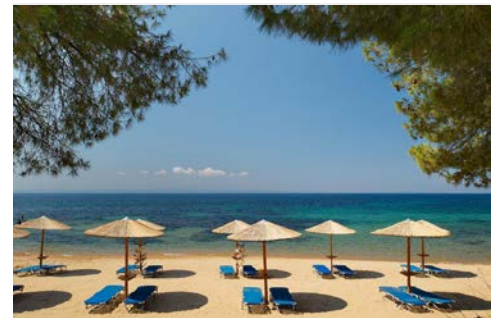
Genießen Sie Ihre Zeit im Hotel oder am Strand

durch eine langgestreckte, fruchtbare Ebene des Tempi-Tals nach Larissa und weiter nach Kalambaka. Kurz hinter Kalambaka erheben sich die steilen Felskegel, die im Tal des Pinios auf ihren Kuppen die berühmten Klöster beherbergen. Hoch oben auf den Spitzen der Felsen gelegen, dem Himmel näher als der Erde, sind die Klöster Anfang des 14. Jahrhunderts erbaut worden. Fast meint man „schwebende Kirchen“ zu sehen. Über Strickleitern, versteckte Treppen im Inneren der Felsen, oder in Tragekörben, die per Seilwinde nach oben in luftige Höhe gezogen werden, sind die Klöster zu erreichen. Nur wenige sind für die Öffentlichkeit zugänglich. Zwei von Ihnen werden besichtigt. Ein James-Bond-Film machte den Felsen und das Kloster Agia Triada „Heilige Dreifaltigkeit“ weltweit bekannt.