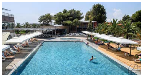
Blue Dolphin Resort – Pool