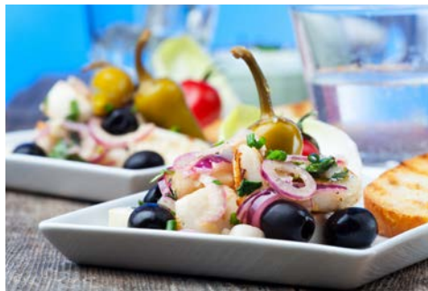
Griechische Küche – einfach lecker!

Nach der Ankunft in Thessaloniki am Flughafen Thessaloniki erfolgt der Transfer zu Ihrem gebuchten Hotel.