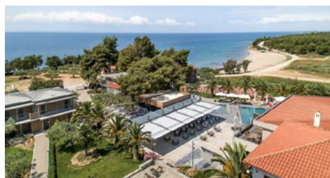
Blue Dolphin Resort

Hinweis zur Barrierefreiheit: Unser Angebot ist für Reisende mit eingeschränkter Mobilität nur bedingt geeignet. Bitte kontaktieren Sie uns bezüglich Ihrer individuellen Bedürfnisse.