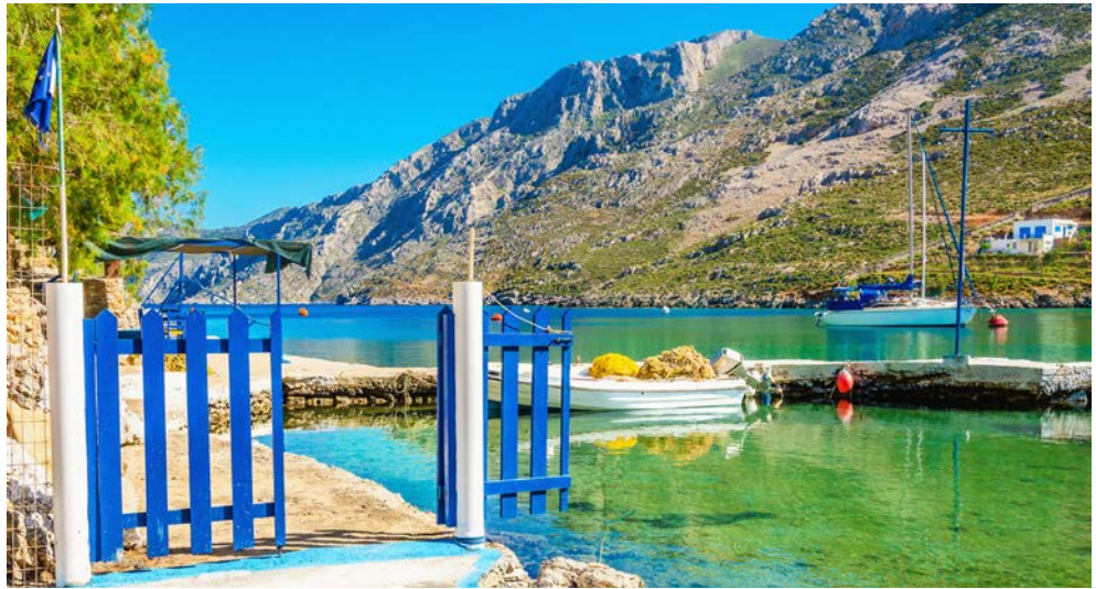
Freuen Sie sich auf fantastische Impressionen

Ihr Urlaubsdomizil für die nächsten Tage befindet sich auf der Halbinsel Sithonia. Die weitläufige Hotelanlage bietet viele Annehmlichkeiten für erholsame Urlaubstage.