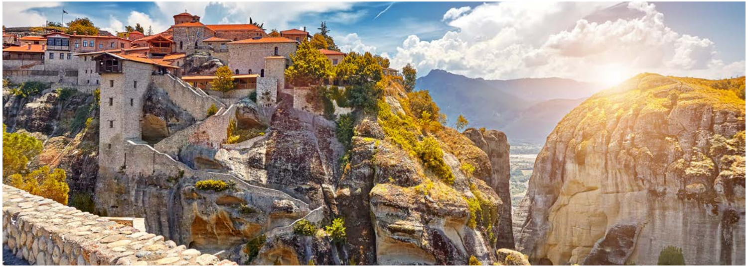
Beeindruckend – Meteora-Klöster