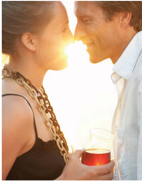
Genießen Sie Ihre Zeit an Bord

Einzelkabinen/-zimmer ab € 4.539,- auf Anfrage. Sie erhalten Ihre Kabinennummer mit den Reiseunterlagen. Zzgl. Visum USA: ESTA-Gebühren in Höhe von derzeit USD 21,- p.P.