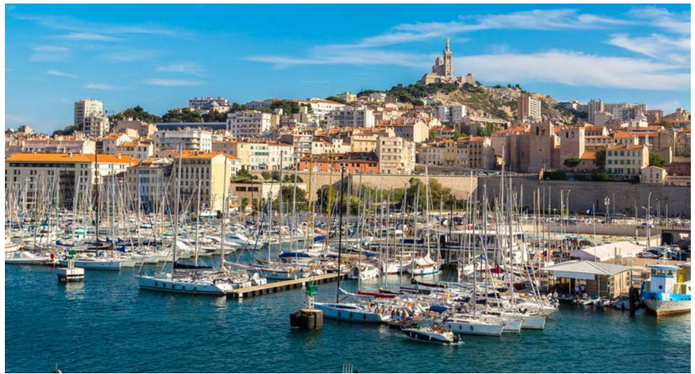
Hafen von Marseille