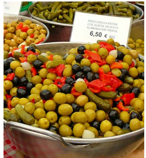
Ein Marktbesuch darf nicht fehlen