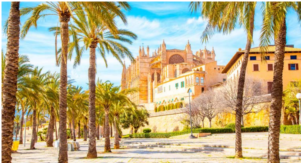
Kathedrale in Palma