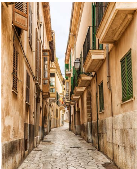
Altstadt von Palma de Mallorca

Palma de Mallorca, die Hauptstadt der Balearen, zählt zu den schönsten Städten des Mittelmeeres. Mit etwa 450.000 Einwohnern lebt hier die Hälfte der Gesamtbevölkerung. Lassen Sie sich beeindrucken