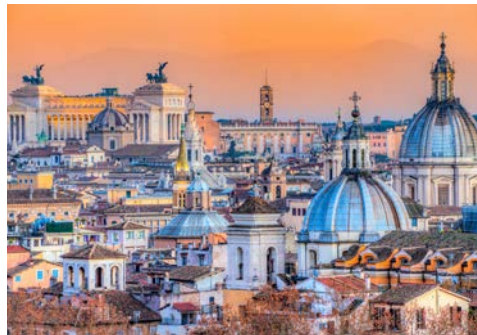
Blick über Rom

Wie schön, dass Ihre Kreuzfahrt mit einem entspannten Seetag beginnt. Leben Sie sich in Ruhe ein und erkunden Sie die vielfältigen Möglichkeiten, die Ihnen AIDAdiva bietet.