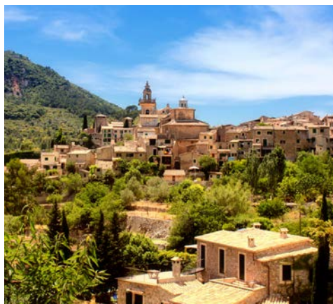
Die Bergwelt Valldemossa

von der Lage der "La Ciutat" (die Stadt ) an einer der herrlichsten und mit 20 km Länge, einer der großzügigsten Buchten des Mittelmeerraumes. Ein Stadtrundgang (optional zubuchbar) führt Sie durch Altstadtgassen mit sehenswerten, historischen Bauwerken und Innenhöfen und eine Besichtigung der berühmten Kathedrale erwartet Sie. Der fantastische Panoramablick von der Festung Bellver, über die Stadt und die Hafenanlagen, runden diesen halbtägigen Ausflug ab.