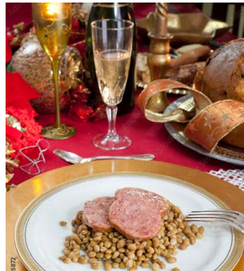
Traditionell zu Silvester: Linsengericht & Spumante