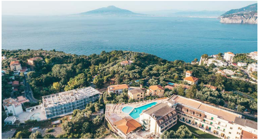
Das GRAND HOTEL VESUVIO in Sorrent

(bestehend aus 4 Ausflügen: Entlang der Amalfi- küste; Ganztagesausflug Pompeji mit Mittagessen & Weinverkostung; Halbtagesausflug Herculaneum; Tagesausflug Neapel mit Pizza-Essen) mit Deutsch- sprechender Reiseleitung; MTZ: 20 Personen)