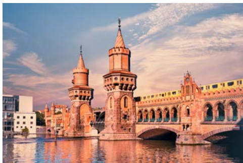
Die Oberbaumbrücke gilt als schönste Brücke Berlins

Vorbei am Schloss Bellevue und über die Spree, steigen Sie dann am Bundeskanzleramt aus und gehen über den Platz zum Reichstag, um von außen das Zentrum des politischen Wirkens zu betrachten, das gleichzeitig eines der architektonischen Meisterwerke der jüngeren Geschichte sein eigen nennt – die große gläserne Kuppel umrahmt vom klassizistischen Gebäudeensemble.