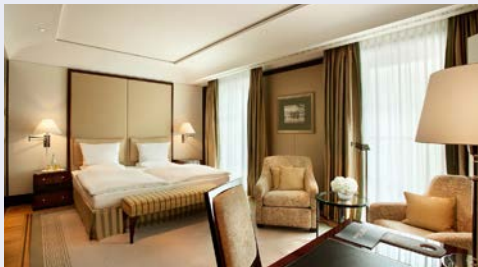
Zimmerbeispiel im Hotel Adlon Kempinski Berlin

Es ist eine der ersten Adressen in Berlin und Deutschland: das Hotel Adlon Kempinski Berlin direkt am Brandenburger Tor. Bedeutende Politiker, Künstler, Sportler und Wirtschaftsfunktionäre gehen hier ein und aus. Das Adlon Kempinski gehört zu den besten und bekanntesten Luxushotels der Welt. Lorenz Adlon, der berühmte Hotelier, erfüllte sich 1907 seinen Traum und baute am Brandenburger Tor „sein“ Hotel, das in den 20er Jahren Weltruhm erlangte. Während des Zweiten Weltkrieges als Lazarett genutzt, blieb es bis kurz vor Kriegsende nahezu unbeschädigt, ehe es aufgrund eines Brandes Anfang Mai 1945 größtenteils zerstört wurde. Zu DDR-Zeiten war im erhalten gebliebenen Flügel ein Hotel der DDR-Handelsorganisation HO untergebracht. Anfang der 70er-Jahre zog eine Lehrlingsschule in den Restbau ein. Endgültig abgerissen wurden die Ruinen 1984.