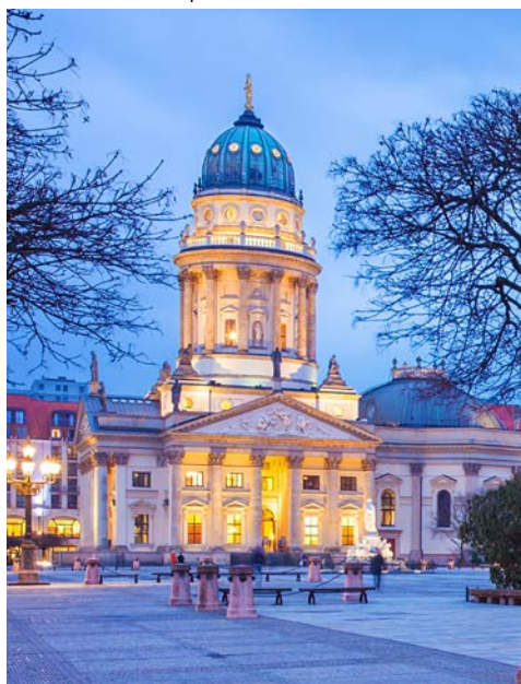
Gendarmenmarkt, Französischer Dom

Berlin, nur wenige Städte haben eine Vergangenheit so geschichtsträchtig, wie die der deutschen Hauptstadt. Das historische Zentrum mit dem alten Prachtboulevard Unter den Linden lässt sich wunderbar zu Fuß erkunden. Ein professioneller Reiseleiter nimmt Sie mit auf eine spannende Route vorbei an Denkmälern, Wahrzeichen und moderner Architektur. Das Hotel Adlon befindet sich bereits mitten im historischen Stadtkern umgeben von der französischen, britischen und amerikanischen Botschaft, so dass die Tour direkt vom Hotel starten kann. Nach zirka zwei informativen und spannenden Stunden endet die