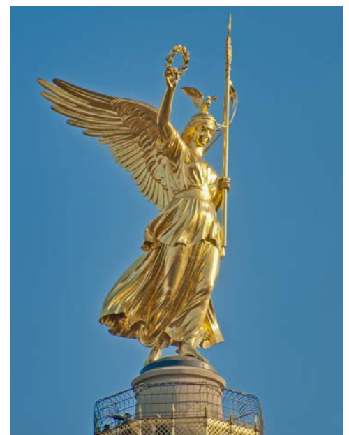
Viktoria auf der Siegessäule