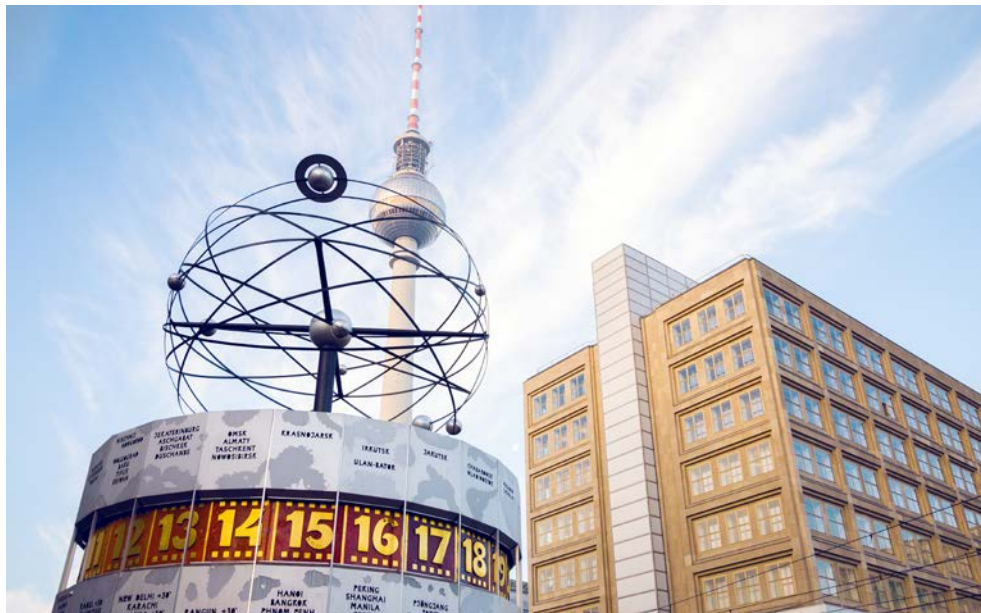
Weltzeituhr auf dem Alexanderplatz

Es ist die erste Adresse der Hauptstadt: das legendäre Luxushotel Adlon Kempinski Berlin. Internationale Staatsgäste und Stars geben sich hier regelmäßig die Klinke in die Hand. Schräg gegenüber von Berlins weltbekanntem Wahrzeichen, dem Brandenburger Tor, gelegen, genießt das renommierte Gästehaus Weltruf. „Adlon oblige“ – Adlon verpflichtet, lautet das Credo des Eleganz und Genuss vereinenden Hauses mit seinen äußerst komfortabel ausgestatteten Zimmern. Damit knüpft das 1997 wiedereröffnete Hotel an die Tradition des historischen Adlon an und steht dadurch gleichermaßen für das alte und das neue Berlin, jene verschiedenen Seiten der Hauptstadt, die Sie auf mehreren Touren entdecken. Sie sehen unter anderem den Gendarmenmarkt, das Regierungsviertel, den Kurfürstendamm und den Reichstag. Ein weiterer Höhepunkt ist ein Ausflug in die berühmte Schlösser- und Parklandschaft von Sanssouci in Potsdam.