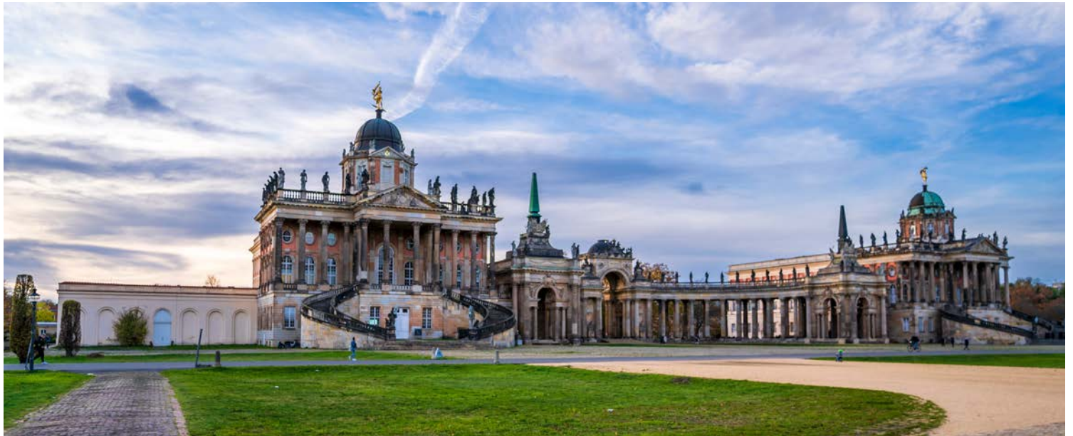
Neues Palais in Potsdam

Gedächtniskirche, das Mahnmal für den Frieden. Nach einem Abstecher auf den Kurfürstendamm, dem Inbegriff für Großstadtflair und Einkaufswünsche, fahren Sie Richtung Regierungsviertel, wo Sie auf der Straße des 17. Juni die „Gold-Else“ bewundern können, wie die Berliner liebevoll die vergoldete Bronzeskulptur der Siegesgöttin Viktoria auf der Siegessäule getauft haben.