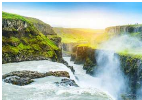
Der Gullfoss – der „Goldene Wasserfall“

Reykjavik, die Hauptstadt Islands, ist die am nördlichsten gelegene Hauptstadt der Welt. Ihr Name wird im isländischen als „Rauchende Bucht“ übersetzt – vermutlich aufgrund der Dämpfe von den vielen heißen Quellen. Die Altstadt wird vom architektonisch interessanten Rathausbau dominiert. Viele alte Villen und historische Häuserfassaden prägen das Straßenbild ebenso wie weitläufige Grünanlagen, das imposante Regierungsgebäude und die Universität. Eine mögliche Stadtrundfahrt oder Ausflüge