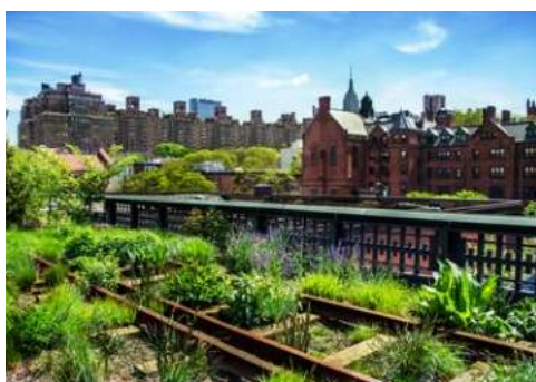
Blick von der High Line Richtung Empire State Building

Silhouette von Wolkenkratzern wird auch Ihnen der Atem stocken. Vorbei an der Freiheitsstatue auf Ellis Island, eröffnet sich eine der aufregendsten Augenblicke der Kreuzfahrt! Die Mein Schiff 1 legt an in Bayonne, direkt gegenüber von Manhattan. An Bord werden Ihnen viele Ausflugsmöglichkeiten geboten, um die „Hauptstadt der Welt“ kennen zu lernen. Sie bleiben über Nacht an Bord.