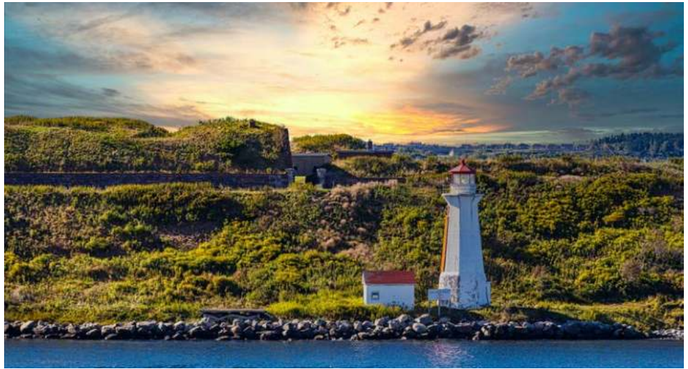
Küstenimpressionen bei Halifax