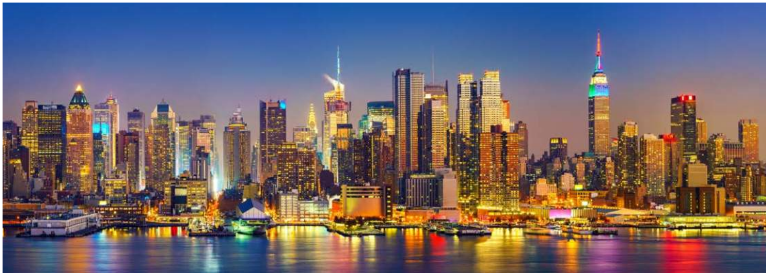
Was für ein Anblick – Skyline von Manhattan