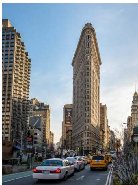
Eine architektonische Ikone – das Flatiron Building

Am Morgen werden Sie zum zweiten Teil Ihrer Stadtrundfahrt abgeholt. Das geschäftige Stadtviertel Midtown Manhattan bietet berühmte Sehenswürdigkeiten wie den Times Square und das Museum of Modern Art sowie architektonische Wahrzeichen wie das Chrysler Building, das Grand Central Terminal, das Flatiron Building und das Empire State Building. Konzerte finden regelmäßig in der Radio City Music