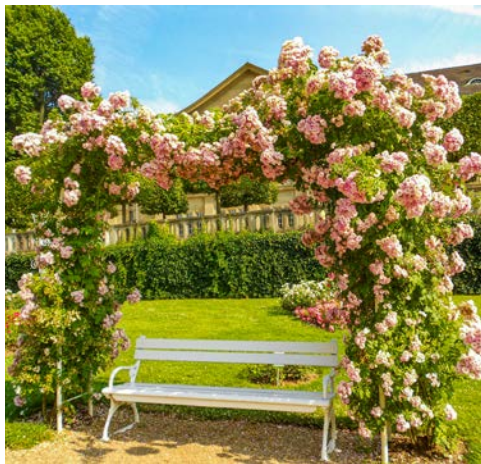
Genießen Sie die Blütenpracht in Bad Kissingen