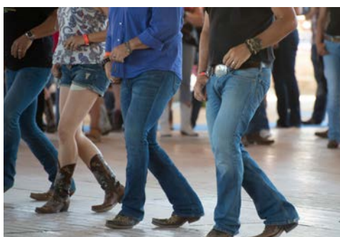
Freuen Sie sich auf eine Runde Line Dance

Reisepreise zzgl. Kurtaxe € 3,90 p.P./Tag, zahlbar vor Ort im Hotel. Zwischenverkauf einzelner Zimmerkategorien vorbehalten.