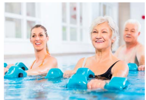
Freuen Sie sich auf ein umfangreiches Aquafit-Programm