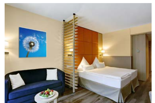
Einzel-/Doppelzimmer de Luxe