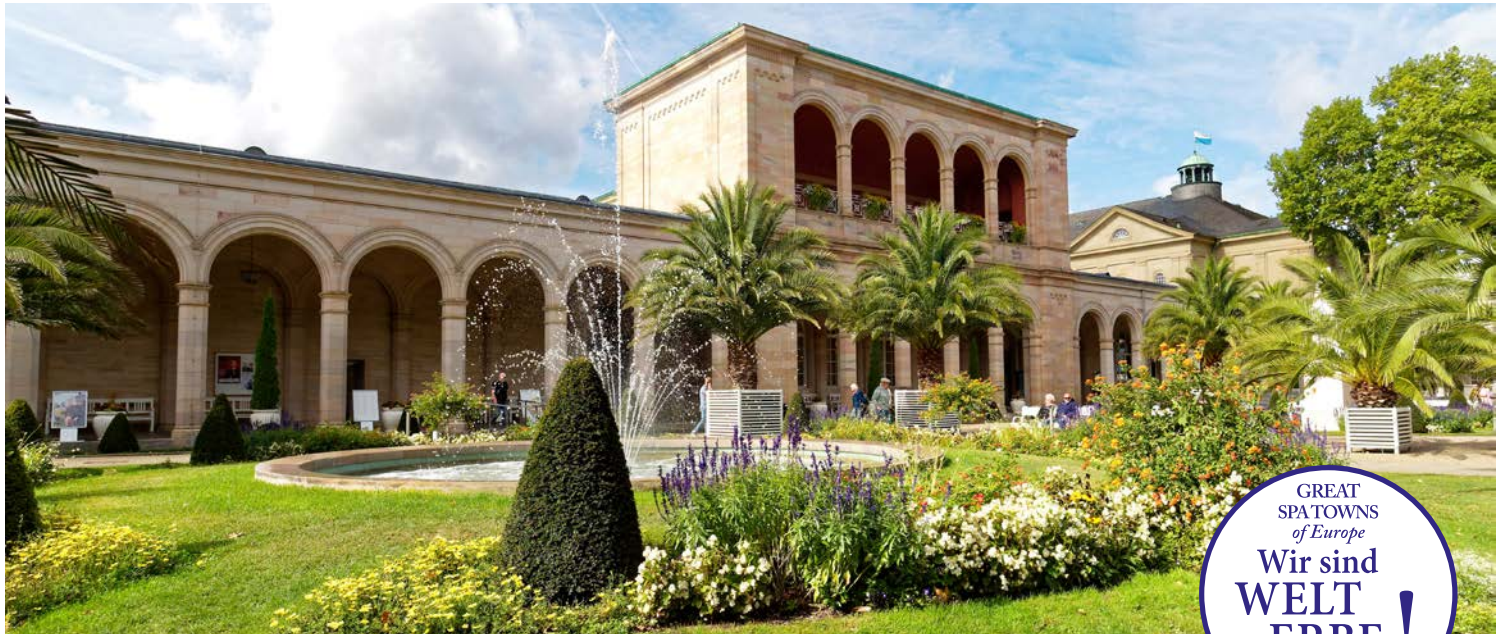
Die sommerliche Fahrt ins Bad – erleben Sie Bad Kissingen zur schönsten Jahreszeit!