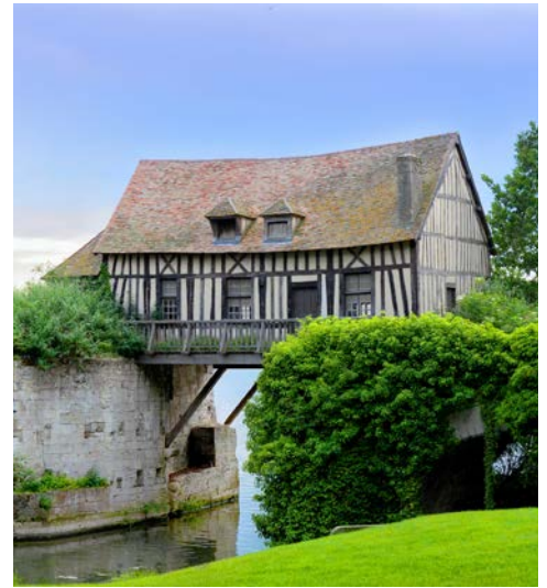
Historische Mühle in Vernon

Eisenbahnverbindung nach Paris erschuf. Bei einer kleinen Rundfahrt können Sie die direkt am Atlantik liegenden Prachtbauten bestaunen.