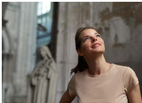
Auf dieser Reise gibt es so viel zu entdecken

Durch den gestrigen Nachmittag und den heutigen kompletten Tag, haben Sie zum Glück ausreichend Zeit, Vernon und die fantastische Umgebung zu entdecken. Wie wäre es mit einem Ausflug nach Giverny? Weltberühmt durch Claude Monet, der sich hier über 40 Jahre seines Lebens niedergelassen hat. Die berühmten Seerosen in seinem eigenen Teich sowie die Blumenwiese hinter seinem Haus sind zu impressionistischen Meisterwerken geworden. Heute beheimatet sein ehemaliges Wohnhaus ein umfangreiches Museum. Sie besichtigen den Garten und das Wohnhaus von Monet und haben ausreichend Freizeit das Örtchen auf sich wirken zu lassen. Und auch Vernon selbst lohnt einen ausgiebigen Blick: Die charmante Kleinstadt besitzt ein bestechendes Architekturerbe mit der denkmalgeschützten Stiftskirche Notre-Dame und zahlreichen historischen Gebäuden. Sehenswert sind auf jeden Fall die Reste der Pont vieux de Vernon mit der historischen Mühle aus Holzfachwerk aus dem 16. Jahrhundert, die Monet unzählige Male als Inspiration und Modell diente. Imposant ist auch das Schloss Bizy am südlichen Rande der Stadt mit einer dokumentierten Geschichte der Familie Jubert, angefangen im 14. Jh. bis zur heutigen Eigentümerin und Nachfahrin Madame Vergé.