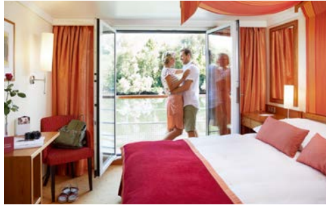
Kabinenbeispiel Kat. C/D

Lassen Sie sich treiben und genießen Sie die malerischen Landschaften entlang der Seine vom großzügigen Sonnendeck aus. Jeden Tag erleben Sie – sei es gemütlich von der Reling aus oder entdeckend bei einem Landgang – eine andere bezaubernde Stadt. Wellness im SPA-ROSA mit einzigartigem Ausblick aus dem Sanarium mit Panoramablick oder aus dem Whirlpool im Außenbereich am Bug des Schiffes runden das Erlebnis ab. Nicht zu vergessen die kulinarischen Highlights vom Buffet mit Live-Cooking. Am Ende eines unvergesslichen Tages bietet Ihre komfortable Kabine, teils mit französischem Balkon, die Möglichkeit, die schönsten Momente Revue passieren zu lassen.