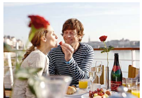
Genießen Sie das Leben an Bord der A-ROSA VIVA!

*Premium-Getränke von renommierten Marken ganztags inklusive: Tee, Kaffee und Kaffeespezialitäten, Wasser, Softdrinks, Biere sowie Sekt und eine Auswahl an Weinen, Cocktails und Longdrinks auch außerhalb der Tischzeiten. Weitere Getränke gegen geringen Aufpreis.