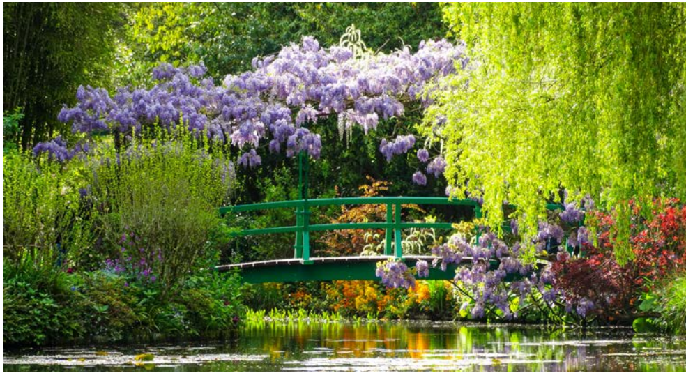
Die Japanische Brücke, eines der berühmtesten Werke Monets, hier in seinem Garten in Giverny