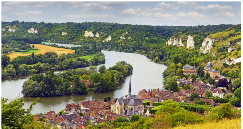
Die malerische Seine bei Les Andelys

Unbedingt empfehlenswert ist der buchbare Ausflug „Entlang der Côte Fleurie nach Honfleur und Deauville“: Direkt an der Mündung der Seine in den englischen Kanal gelegen hat Honfleur sich zu einem der reizvollsten Städtchen der Normandie entwickelt. Nach einem Bummel durch die gemütlichen Gassen und entlang des Hafens besuchen Sie noch ein kleines Calvadosgeschäft und dürfen natürlich auch die leckeren Tropfen genießen. Anschließend fahren Sie weiter über die Blumenküste nach Deauville. Dieses mondäne Seebad geht auf Charles de Morny – einem Halbbruder von Napoleon III. zurück, der Mitte des 19. Jh. hier innerhalb von nur 4 Jahren ein Seebad mit neoromanischen Villen, Pferderennbahn und