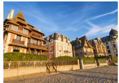
Deauville, Prachtvillen direkt am Strand

Ihre Reise beginnt in Paris. Aufgrund der Olympischen Sommerspiele in Paris werden Sie am Flughafen willkommen geheißen und zum Hafen in Le Pecq begleitet (bei Flugbuchung gemäß letzter Seite). Hier wartet bereits die A-ROSA VIVA zur Einschiffung auf Sie. Freuen Sie sich auf eine ereignisreiche Reise mit vielen wunderschönen Impressionen.