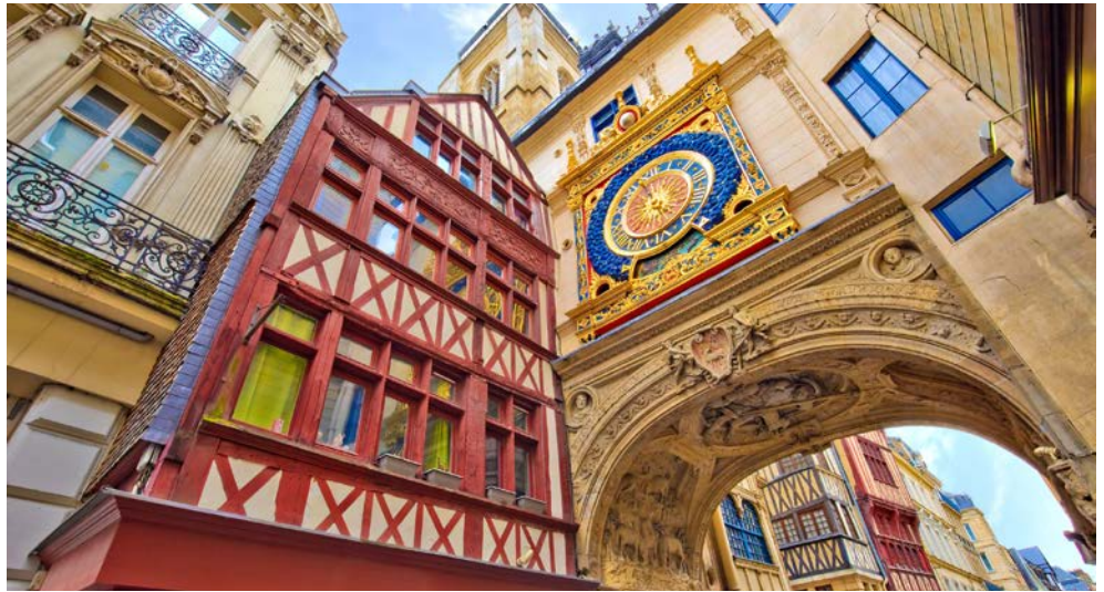
Rouen – einfach sehenswert

„Leben wie Gott in Frankreich“, eine Redewendung, die jeder kennt und sich hartnäckig hält – und das aus gutem Grund. Es gibt wohl kein anderes europäisches Land, dessen Natur und Kultur so vielfältige Möglichkeiten bieten, sich sowohl dem Genuss als auch dem Sightseeing hinzugeben. Insbesondere die Normandie vereint große Geschichte, traumhafte Landschaften und berühmte Kulinarik, allen voran die drei großen C's: Cidre, Calvados und Camembert. Kommen Sie an Bord der A-ROSA VIVA mit auf die Seine – ein Fluss, der Geschichte schrieb, Kunstwerke schuf und in malerischen Talschleifen die französische Hauptstadt mit dem Meer verbindet. Auf dieser einzigartigen Route entdecken Sie wahre Perlen der unvergleichlichen Normandie. Blumenwiesen, Apfelbäume und Kalkfelsen im goldenen Licht säumen dabei Ihren Weg.