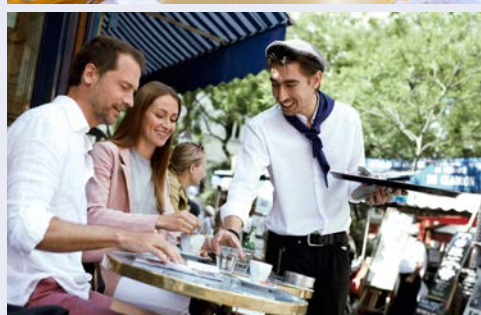
Genießen das französische Lebensgefühl