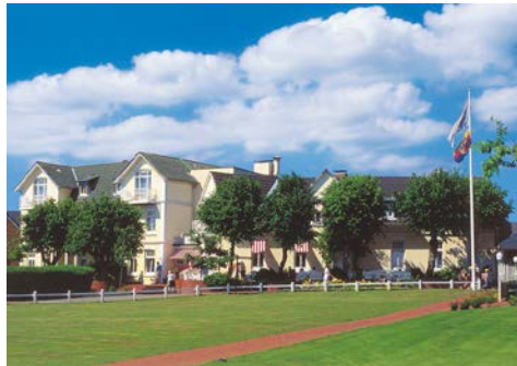
Ihr Sonnenresort Hüttmann

Im Ortskern von Norddorf gruppiert sich rund um die Hüttmann-Wiese die Hotelanlage des Sonnenresort Hüttmann . Alle gemütlichen Zimmer verfügen über Dusche/WC, Föhn, Farb-TV, Wertfach, Radio und Telefon. Im Restaurant nehmen Sie Ihre Mahlzeiten ein. Im Café-Bistro „Dat Sünn Huus“ können Sie ganz gemütlich Kaffee trinken und in der „Entenschnack-Bar“ den Tag ausklingen lassen. In der Gesundheitsoase finden Sie eine Sauna, Dampfbad und Einzelwhirlpool.