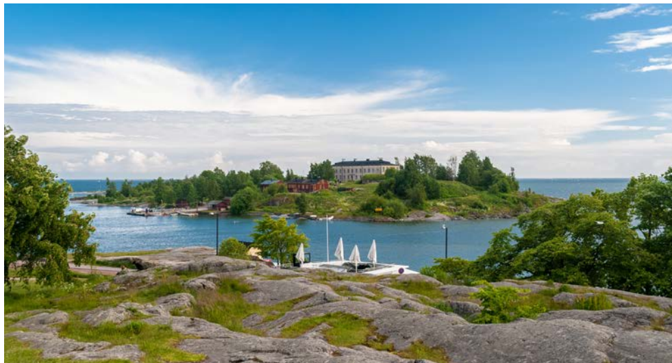
Sommerliches Helsinki – Blick vom Kaivopuisto-Park auf das Inselchen Harakka

Traditionell gastfreundlich und aufgeschlossen sind die Bewohner Finnlands. Wer einmal mit Finnen ein Sommerwochenende an einem der tausend Seen im idyllischen Sommerhäuschen verbracht und die Sauna genossen hat, der kann sich denken, warum Finnland seit Jahren den ersten Platz im sogenannten Glücksatlas inne hält.