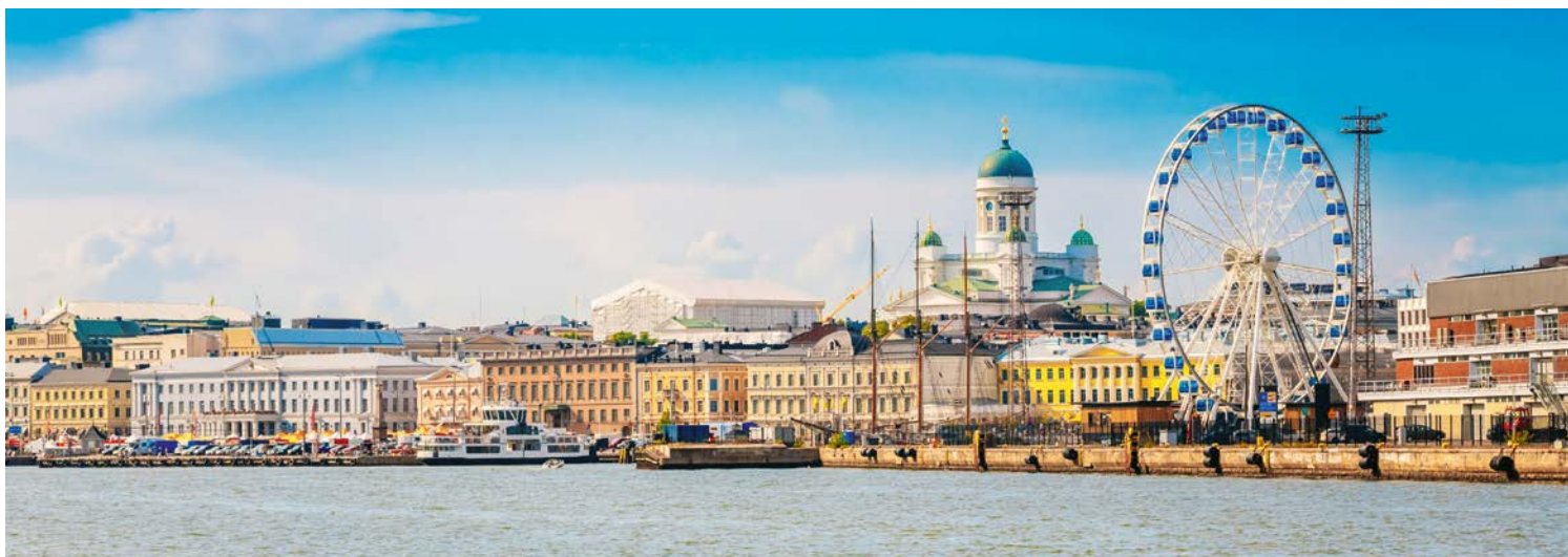
Helsinki – Stadt am Meer