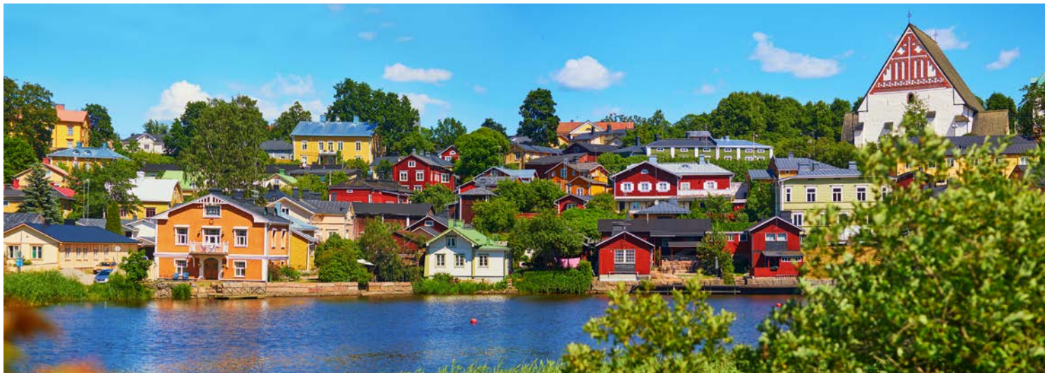
Traumhaftes Städtchen – Porvoo