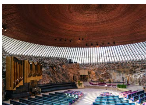
Imposante Felsenkirche Tempelium