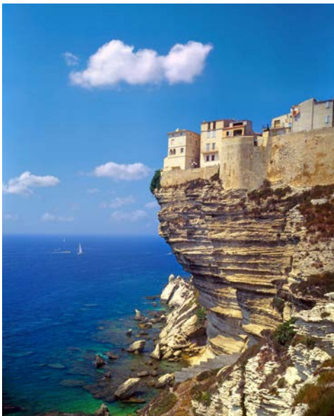
Bonifacio auf Korsika

Nach dem Frühstück im Hotel heißt es „Abschied nehmen“ von Ihrem wunderschönen Hotel.