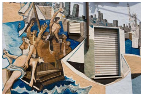
Die sogenannten „Murales“ in Orgosolo

Der heutige Tagesausflug führt Sie in das Kernland Sardinien. Morgens besuchen Sie zunächst das Trachtenmuseum in der Provinzhauptstadt Nuoro, mit der umfangreichsten Sammlung volkskundlicher Exponate Sardinien. Anschließend fahren Sie zum berühmten Gebirgsort Orgosolo, einst Heimat vieler