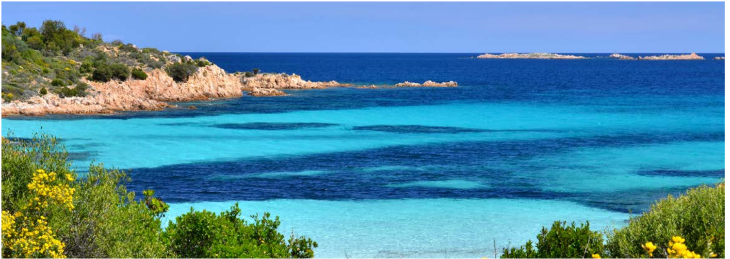
Traumhafte Küstenlandschaften erwarten Sie