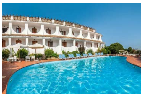
Poolanlage des Hotels Punta Est

Das beliebte Hotel (Landeskategorie: 4 Sterne) liegt im Herzen der Baja Sardinia an der Costa Smeralda. Der Strand ist nur 200m vom Hotel entfernt. Zu den Einrichtungen des mediterranen Hotels zählen ein Restaurant, eine Bar und eine Außenpoolanlage. Genießen Sie das im landestypischen Stil erbaute Hotel u.a. mit Bar, Sonnenterrasse, sowie Fitness- und Wellnessbereich. Lift vorhanden, WLAN kostenfrei. Die insgesamt 150 Zimmer sind komfortabel mit Badezimmer mit Duschkabine, Balkon, Minibar, Safe, Klimaanlage, Haartrockner, Telefon und Sat-TV ausgestattet.