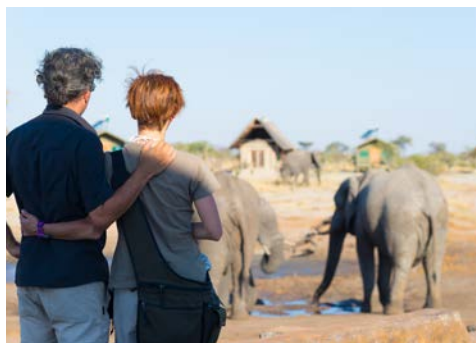
Abschied fällt manchmal schwer