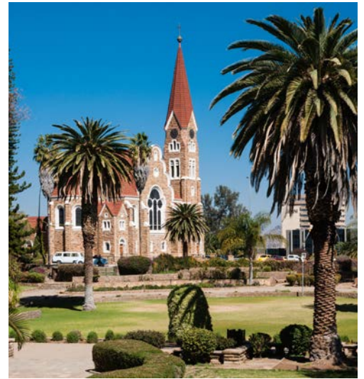
Auf den Spuren deutscher Kolonialgeschichte in Windhoek