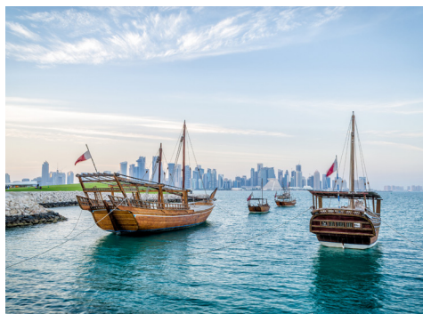
Stilechte Dhows vor der Skyline in Doha

Eine Hauptattraktionen der Stadt Doha ist die kilometerlange Promenade (Corinche) am Wasser. Sie können die gesamte Corinche entlang schlendern bis zum futuristischen Viertel West Bay, in dem sich Architekten gegenseitig mit außergewöhnlichen Wolkenkratzern übertrumpfen wollen. An der Corinche sind einige der schönsten Museen von Katar angesiedelt, die nicht nur Kulturfreunde in ihren Bann ziehen. Zum Beispiel das 2008 eröffnete Museum für Islamische Kunst des bekannten Architekten I. M. Pei besticht schon von außen durch seine ungewöhnliche, sandsteinfarbene Gestalt. Im Inneren beherbergt es die Kunstschatze der Emire von Katar und spiegelt über 1.000 Jahre Kulturgeschichte der arabischen Region wider.