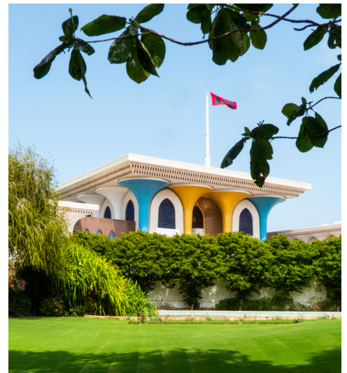
Der Sultanspalast in Maskat

„Dubai Lake“ mit den unvergleichlichen „Dubai Fountain“: das 150 m hohe Klangspektakel aus Fontänen und Licht ist einzigartig auf der Welt. Mittags erfolgt der Transfer zum Hafen und die Einschiffung auf AIDAprima. Leben Sie sich in Ruhe an Bord ein.