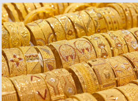
Der Goldsouk in der Dubai Mall beherbergt 220 Shops

Der Vormittag steht Ihnen für eigene Unternehmungen zur freien Verfügung. Vielleicht besuchen Sie die Marina und das „Szene-Viertel“ Downtown Burj Dubai. Das Zentrum bildet der künstliche See