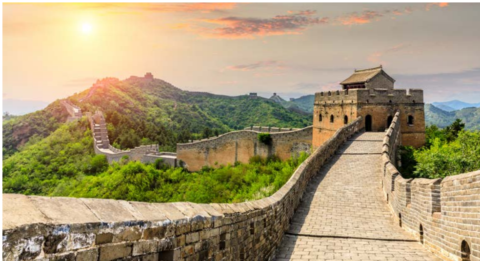
Die Chinesische Mauer auch Große Mauer genannt