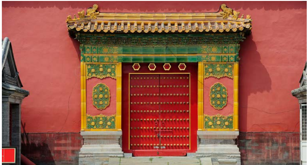
Das Tor zur „Verbotenen Stadt“

Sie beginnen Ihren Tag mit einem Spaziergang über den Platz des „Himmlischen Friedens“, den Tian'anmen-Platz. Er gehört zu einem der größten Plätze der Welt und wird von der Volkskongresshalle, der Mao-Zedong-Halle und dem Tian'anmen Tor flankiert, von dem Mao Zedong am 1. Oktober 1949 die Volksrepublik China ausrief. Traurige Berühmtheit erlangte er im Juni 1989 durch die gewaltsame Niederschlagung der Proteste der chinesischen Demokratiebewegung ganz in der Nähe des Platzes. Der Kaiserpalast oder auch die „Verbotene Stadt“ ist das größte und bedeutendste Bauwerk Chinas. Die 720.000 m 2 große Anlage ist von einer 10 m hohen purpurnen Mauer umgeben, und verwehrt einst dem normal Sterblichen den Zugang. Der große südliche Teil war vor allem repräsentativen und zeremoniellen