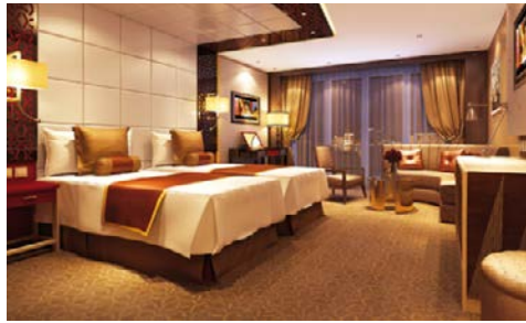
Beispielkabine an Bord der CENTURY PARAGON

Peking: 3 Nächte im Sunworld Hotel Beijing Luoyang: 2 Nächte im Luoyang New Friendship Hotel Xi'an: 2 Nächte im Grand Noble Hotel Xi'an Shanghai: 3 Nächte im Hengshan Garden Hotel Shanghai (Änderungen vorbehalten; alle Landeskategorie: 4 Sterne)