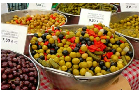
Willkommen auf dem Markt

Gold der Insel entsteht. Weiter geht es zum Kloster Lluc, dem wichtigsten Wallfahrtsort der Mallorquiner. Das Kloster wurde 1250 gegründet und liegt in einem Talkessel des Tramuntana Gebirges. Nach der Besichtigung des Klosters geht es entlang der Bergstraße nach Pollensa. Diese etwa 20 km lange Strecke zählt zu den landschaftlich reizvollsten Gebieten der Insel. Die malerisch gelegene und Stadt Pollensa gilt als Zentrum der Intellektuellen und hat etwa 16.000 Einwohner. Sie besuchen das hübsche Fischer- und Hafenstädtchen Puerto Pollensa, wo Sie die Mittagspause machen werden. Anschließend wird die Fahrt auf die Halbinsel Formentor fortgesetzt. Sie ist eine der landschaftlich eindrucksvollsten Punkte der Insel. Auf beiden Seiten der Landstraße ziehen hinreißende Landschaftsbilder mit Steilküsten, die teilweise über 200 m hoch sind, vorbei. Am Aussichtspunkt „Es Colomer“ können Sie die überwältigende Aussicht bewundern. Am Nachmittag fahren Sie durch das Hauptweinanbaugebiet der Insel, das zwischen Binissalem und Santa Maria liegt. Sie besuchen einen Winzer und probieren die vorzüglichen Weine der Insel. Über Nebenstrecken geht es zurück zum Hotel.