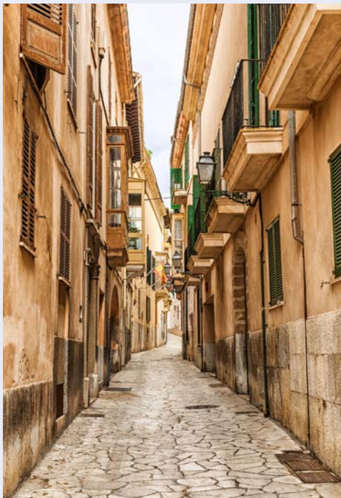
Altstadt von Palma

Sie fahren in Richtung Inca und weiter durch das kleine Bergdorf Selva nach Caimari. Sie machen bei einer Ölmühle halt und sehen, wie das flüssige