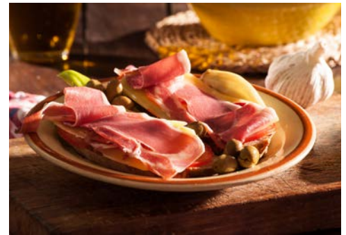
Einfach, pur und köstlich – „Pa amb Oli“

Schinken oder Käse belegt. Dazu wird ein guter Landwein gereicht. Am Nachmittag fahren Sie über verschiedene Dörfer zurück zum Hotel.