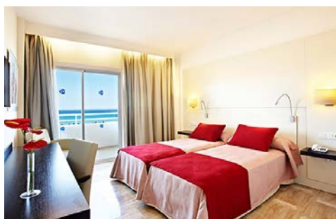
Zimmerbeispiel mit Meerblick

Das Grupotel Taurus Park ist eines der 4-Sterne Hotels in der Bucht von Palma (Landeskategorie). Es liegt nur ca. 500 Meter vom Strand von Palma entfernt, im Herzen der Playa de Palma. Sie wohnen in einem der modernen 341 Zimmer und lassen sich morgens und abends im Buffet-Restaurant kulinarisch verwöhnen. Zu der Anlage des Hotels gehören Tennisplätze, ein Fitnessbereich sowie ein Innen- und ein Außenpool.