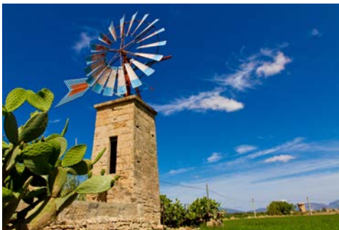
Windmühlen mit Tradition

Gold der Insel entsteht. Weiter geht es zum Kloster Lluc, dem wichtigsten Wallfahrtsort der Mallorquiner. Das Kloster wurde 1250 gegründet und liegt in einem Talkessel des Tramuntana Gebirges. Nach der Besichtigung des Klosters geht es entlang der Bergstraße nach Pollensa. Diese etwa 20 km lange Strecke zählt zu den landschaftlich reizvollsten Gebieten der Insel. Die malerisch gelegene und Stadt Pollensa gilt als Zentrum der Intellektuellen und hat etwa 16.000 Einwohner. Sie besuchen das hübsche Fischer- und Hafenstädtchen Puerto Pollensa, wo Sie die Mittagspause machen werden. Anschließend wird die Fahrt auf die Halbinsel Formentor fortgesetzt. Sie ist eine der landschaftlich eindrucksvollsten Punkte der Insel. Auf beiden Seiten der Landstraße ziehen hinreißende Landschaftsbilder mit Steilküsten, die teilweise über 200 m hoch sind, vorbei. Am Aussichtspunkt „Es Colomer“ können Sie die überwältigende Aussicht bewundern. Am Nachmittag fahren Sie durch das Hauptweinanbaugebiet der Insel, das zwischen Binissalem und Santa Maria liegt. Sie besuchen einen Winzer und probieren die vorzüglichen Weine der Insel. Über Nebenstrecken geht es zurück zum Hotel.