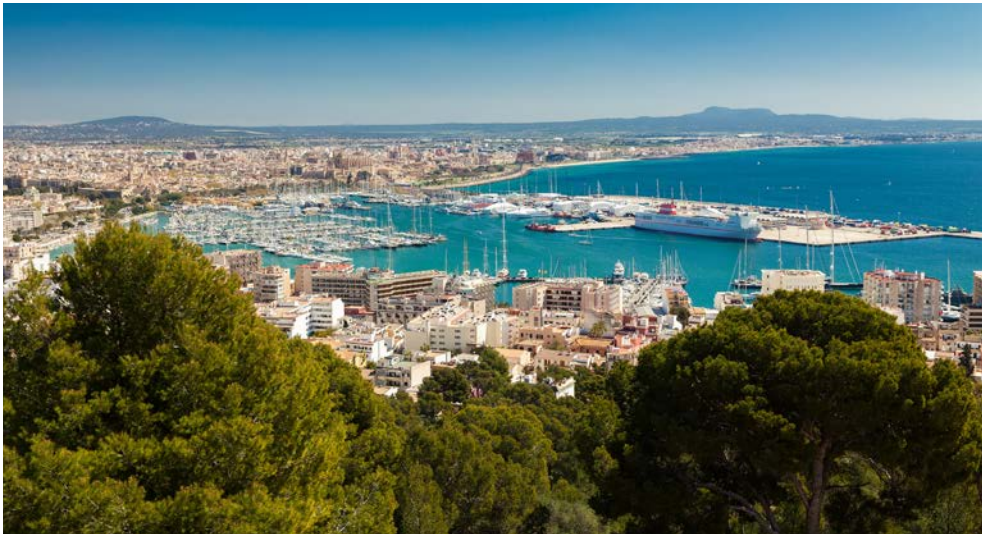
Blick über Palma