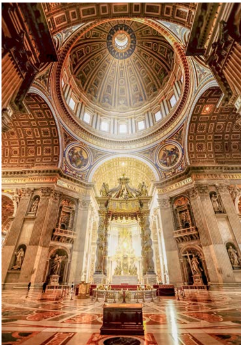
Prachtvoll – der Petersdom