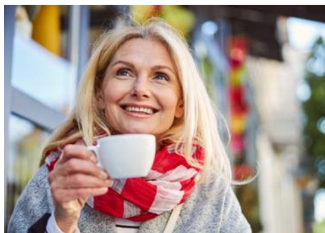
Ein Cappuccino zwischendurch in einer der vielen Bars