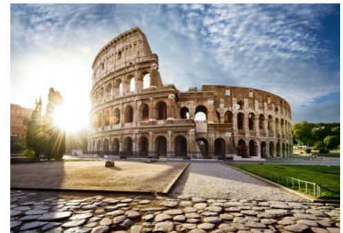
Fantastisch – das Kolosseum

Über den Campo de' Fiori, den bei Römern beliebten Blumen- und Gemüsemarkt, führt der Spaziergang zur Piazza del Popolo, einem der bekanntesten und belebtesten Plätze der Ewigen Stadt. Während Ihres Rundgangs reihen sich Impressionen an Impressionen. Der Nachmittag bleibt Ihnen zur freien Verfügung. Schlendern Sie mit Muße durch das Herz Roms und genießen Sie das unbeschreibliche Flair.