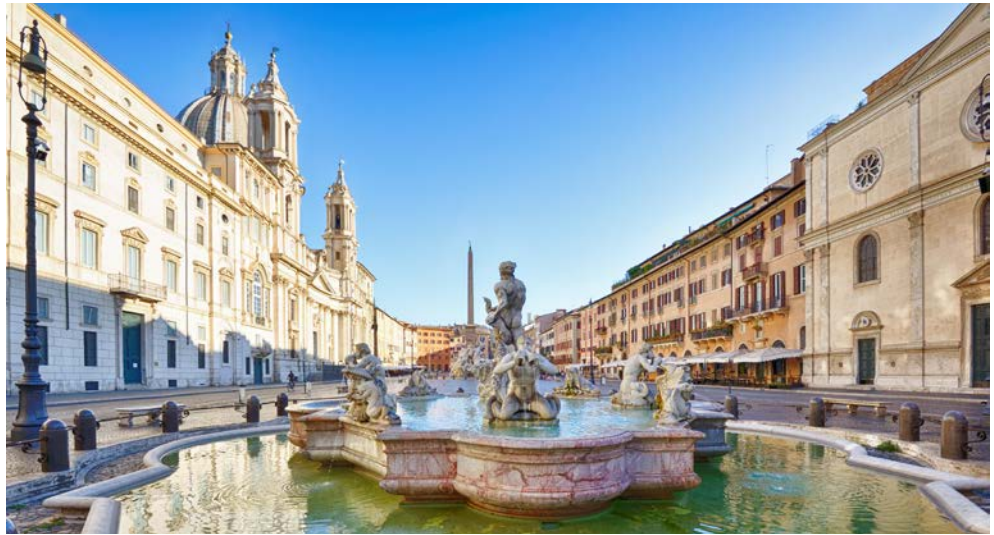
So menschenleer ist es selten auf der Piazza Navona

Ob römische Kaiser, katholische Päpste oder große Mäzenaten: Sie alle hinterließen in Rom ihre Spuren. Ob Kolosseum, Pantheon, Engelsburg, Papstpalast oder Trevi Brunnen, im Rahmen der exklusiven fünftägigen Städtereise sehen Sie die Highlights Roms. Neben diversen Besichtigungen bleibt Ihnen auch genügend Zeit zur individuellen Verfügung um im eigenem Tempo und nach Belieben die Stadt zu erkunden. Wie wäre es zum Beispiel mit einer Streetfood-Tour, den italienischen Köstlichkeiten auf der Spur? Buon Appetito – Pizza und Pasta für Genießer!