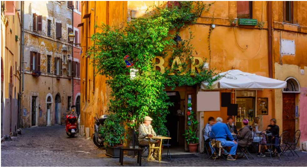
Unweit Ihres Hotels laden schmale Gassen zum Bummel ein