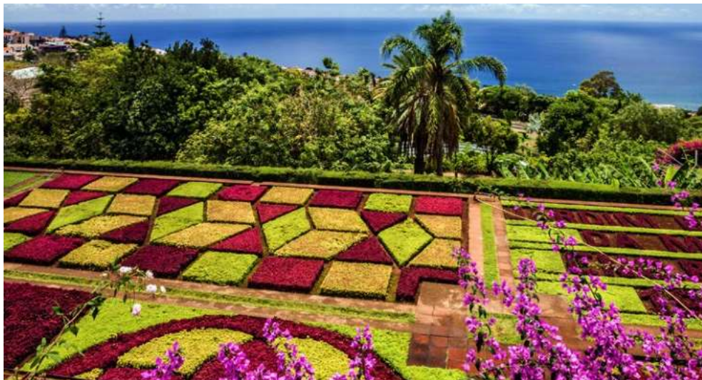
Der Botanische Garten in Funchal, Madeira