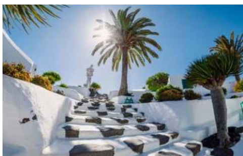
Museo del Campesino auf Lanzarote

Auf Lanzarote beginnt eine neue Welt: Hier eröffnen sich Ihnen unvorstellbar vielfältige Vulkanlandschaften, der Nationalpark Timanfaya mit seinen eindrucksvollen Feuerbergen und die berühmten Werke des Künstlers und Architekten César Manrique. Der Jardin de Cactus z.B., ein riesiger Kakteengarten, der in einen offen gelassenen Steinbruch hinein gebaut wurde, war eine lang gehegte Idee des Künstlers. Bereits im Jahre 1970 entstanden die Pläne des Gartens, doch erst neunzehn Jahre später konnte er ihn endlich im Auftrag der Inselregierung realisieren. Im Norden der Insel hat er in einem einzigartigen, zusammenhängenden Höhlensystem vulkanischen Ursprungs, den Jameos del Agua, ein Zentrum für Kunst und Kultur geschaffen. Kernstück dieser unterirdischen Anlage ist ein Konzertsaal mit etwa 600 Sitzplätzen. Warum machen Sie sich nicht ein Bild von Manriques fantasievollen Kunstwerken, die sich harmonisch in die Natur einfügen?