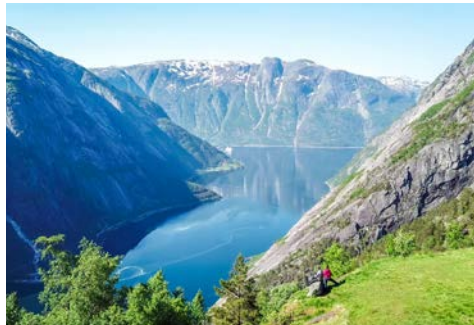
Blick auf den schönen Eidfjord

Sie besuchen die nördlichste Hauptstadt Europas: Reykjavik. Namensgeber der Stadt (Rauchbucht) sind die in der Nähe stehenden natürlichen Dampfsäulen. Reykjaviks Altstadt wird vom architektonisch interessanten Rathausbau dominiert. Viele alte Villen und historische Häuserfassaden prägen das Straßensbild ebenso wie imposante Regierungsgebäude und die isländische Universität. Außerhalb des Altstadtkerns befindet sich Perlan – „die Perle“. Der ultramoderne Glaskuppelbau wurde auf Heißwassertanks