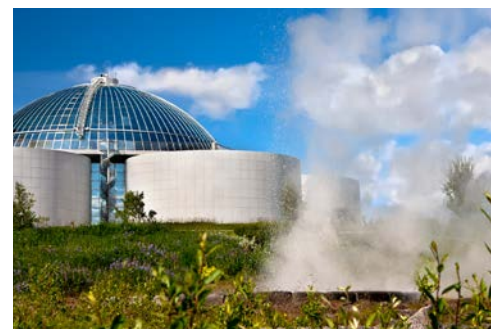
Perlan und die umliegenden Thermalquellen

Lerwick, die einzige richtige Stadt und Verwaltungssitz der Shetland Inseln, im 17. Jhr. gegründet, empfängt Sie mit engen und verschlungenen Closes (so heißen die gewundenen Gassen) und entführt Sie zu einer kleinen Zeitreise durch die Jahrhunderte mit „Stationen“ der Wikinger, die hier rund 700 Jahre lang herrschten, der Heringsfischerei, des Walfangs, Ginchmuggel mit den Niederlanden bis zum Ölfund.