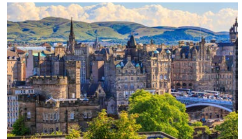
Besuchen Sie Edinburgh

Krönender Abschluss könnte ein Besuch in Edinburgh sein. Sie legen in South Queensferry an, rund 15 km von Edinburgh entfernt. Neben dem Edinburgh Castle, das erhöht auf einem Fels thront, ist Old Town, das historische Edinburgh mit seinen engen Gassen, Pubs und schmalen Häusern aus dem 16. und 17. Jh. sehr sehenswert. Alternativ befindet sich nur rund 8 km