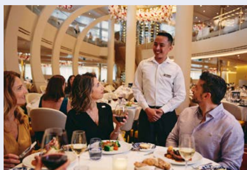
Viel Spaß an Bord!