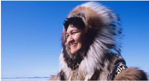
Mannigfache Impressionen erwarten Sie!

errichtet, die aus den umliegenden Thermalquellen gespeist werden und zur Beheizung der Häuser und Schwimmbäder Reykjaviks dienen. Auch die Blaue Lagune ist einen Besuch wert.