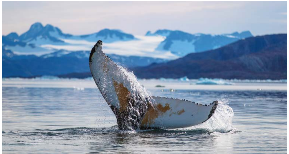
Halten Sie Ausschau nach Walen!

Nanortalik, eine Insel, die durch den Tasermiut Fjord vom Land abgegrenzt ist, ist durch das verzweigte Fjordsystem und die aufragenden Felswände nicht nur etwas für Extremsportler. Der Ort selbst ist winzig und zu Fuß erkundbar. Die Umgebung hält u.a. das einzige Waldgebiet Grönlands am Qinguatal parat.