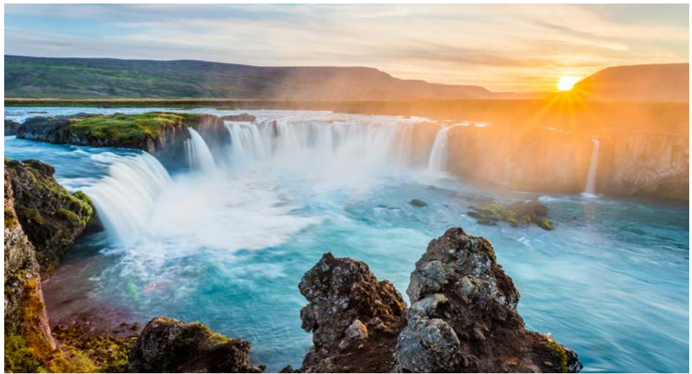
Godafoss in Island, Wasserfall der Götter