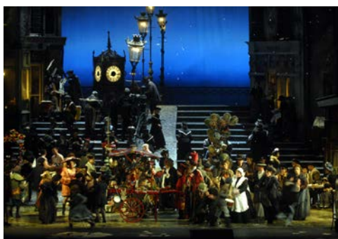
Szenenbild aus „La Bohème“ in der Deutschen Oper

Die Deutsche Oper Berlin pflegt ihre Tradition des individuellen Regie-Theaters. Götz Friedrich, Hans Neuenfels und Achim Freyer gehören zu den namhaften Regisseuren, die mit ihren Inszenierungen am Charlottenburger Opernhaus große Erfolge feierten. Dazu zählt auch die von Götz Friedrich im Jahr 1988 inszenierte Oper La Bohème von Giacomo Puccini. Götz Friedrich verlegt die Handlungszeit vom Paris der 1840er Jahre in die Jahrhundertwende, in die Entstehungszeit der Oper. Mit ihren farbigen Schilderungen des Paris der Belle Époque und den großformatigen Bühnenbildern ist die 2,5-stündige Inszenierung auch nach über 36 Jahren immer noch ein Publikums-Hit. Es spielt das Orchester der Deutschen Oper im Zusammenwirken mit dem Chor und dem Kinderchor der Deutschen Oper.