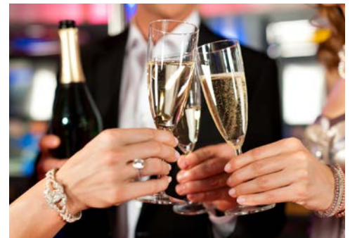
Wir wünschen ein frohes, gesundes neues Jahr!

So werden 280 der 550 Kostüme mit präzise geschliffenen Kristallen in verschiedenen Größen, Farben und Formen versehen. Auch im Bühnenbild kreieren 650 Kilogramm Kristalle eine unvergleichliche Magie. Die Kristallelemente des Sets umfassen unter anderem einen kristallinen Baum und funkelnde