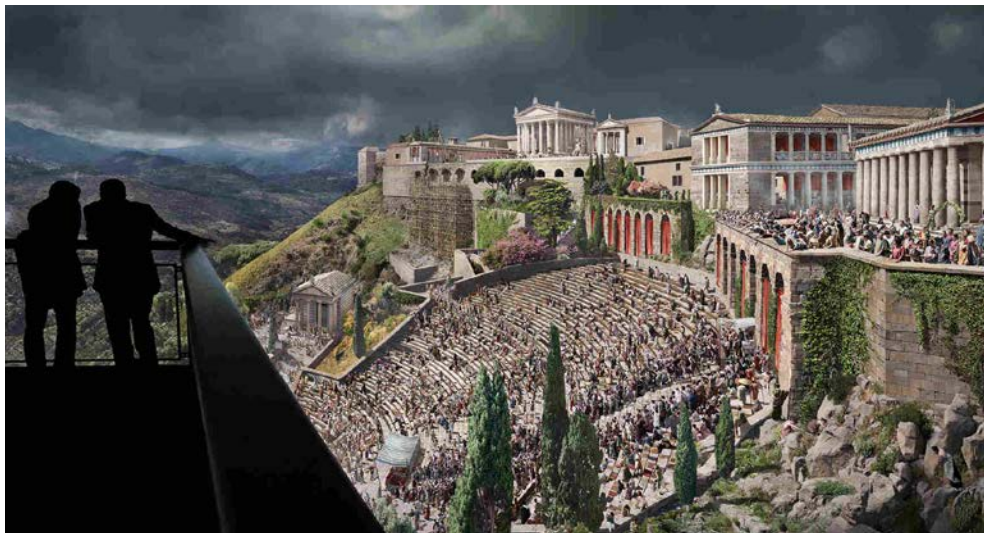
Reise in die Vergangenheit – das Pergamon-Panorama von Yadedar Asisi

Mit der legendären Inszenierung der Oper La Bohème in der Deutschen Oper Berlin und einem exquisiten 4-Gang Silvestermenü inklusive einer Getränkeauswahl im Salon des renommierten Restaurants Brasserie am Gendarmenmarkt erleben Sie einen stilvollen Jahresausklang.