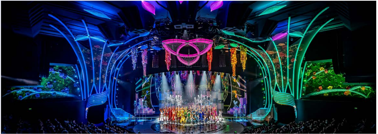
Beindruckendes Bühnenbild: Grand Show „Falling in Love“ im Friedrichstadt Palast

Freuen Sie sich auf einen glanzvollen Jahreswechsel mit einem kulturell hochwertigen und festlichen Programm in Deutschlands Kulturhauptstadt.