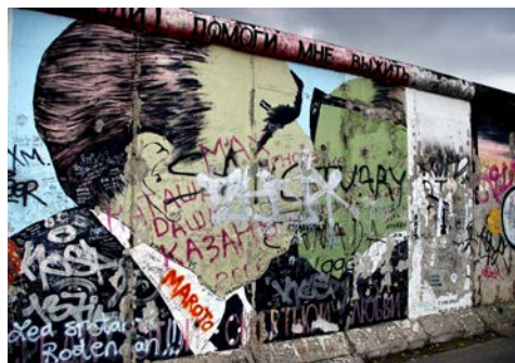
Heute kaum mehr vorstellbar – die Teilung der Stadt

Ihr kompetenter örtlicher Reiseleiter nimmt Sie mit auf eine interessante Spurensuche und führt Sie zu den wichtigsten Sehenswürdigkeiten der westlichen und östlichen Berliner Innenstadt.