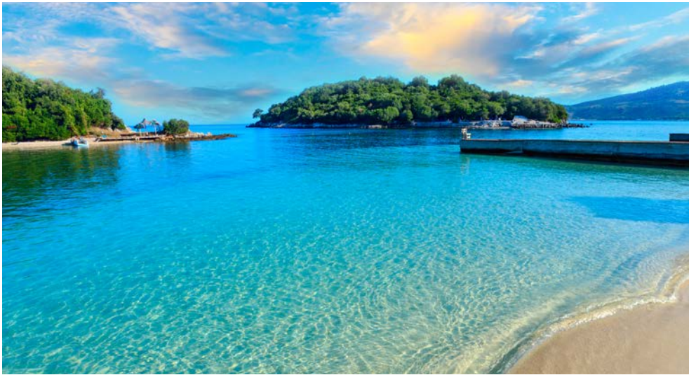
Ksamil – die „Karibik“ Albaniens