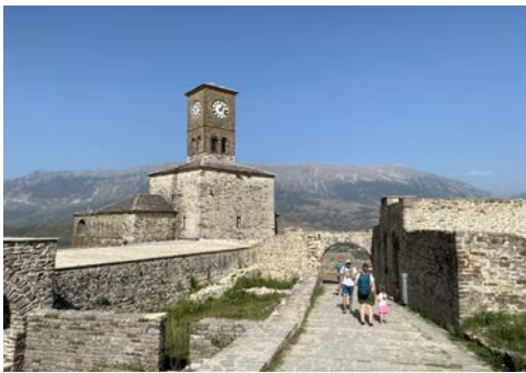
Uhrenturm in Gjirokaster