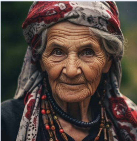
Willkommen in Albanien