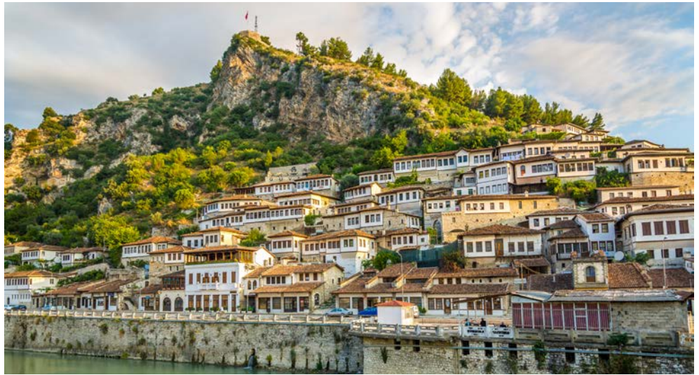
Die „Stadt der tausend Fenster“ – Berat