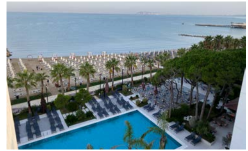
Blick auf den Strand