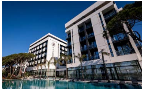
Ihr Hotel in Durres

Meerblickzimmer gegen Aufpreis von 129 € pro Zimmer auf Anfrage buchbar. Reisepreise zzgl. Kurtaxe ca. € 1,50 p.P./Nacht, zahlbar vor Ort.