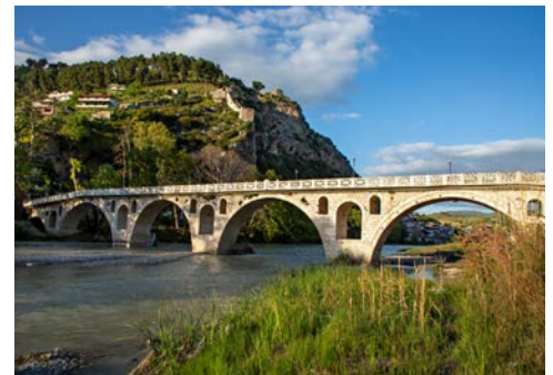
Bogenbrücke in Berat