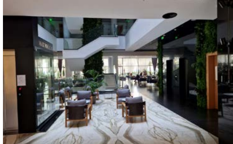
Lobby des Hotels