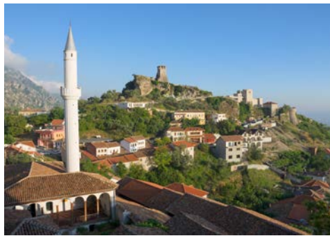
Kruja mit Blick auf die Burg oberhalb der Stadt

Oemal Boulevard, den Isa-Boletini-Platz, sowie das Unabhängigkeitsmuseum (von außen). Fahrt nach Saranda und Bezug Ihres Hotels. Abendessen und Übernachtung.