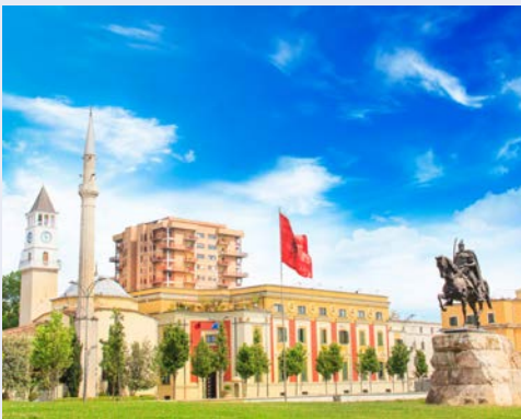
Skanderbeg-Platz in Tirana

Sie behalten Ihr Hotelzimmer in Durres und können somit „mit kleinem Gepäck“ auf diesen fantastischen Zweitagesausflug gehen. Frühstück im Hotel. Heute fahren Sie zu den Ausgrabungen von Apollonia. Vor über 2.500 Jahren errichteten die Griechen hier zu Ehren Apollons eine Kolonie. Nach der Besichtigung Weiterfahrt nach Vlorë, der Stadt der Unabhängigkeit. Sie wurde im 6. Jahrhundert v. Chr. als antike griechische Kolonie unter dem Namen Aulona gegründet. 1912 wurde hier die Unabhängigkeit vom Osmanischen Reich erklärt, und die Stadt Vlorë diente als Hauptstadt Albanien. Sie besuchen u.a. den Platz der Unabhängigkeit, die Altstadt, den Ismail