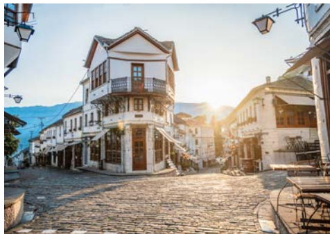
Gassen in Gjirokastra