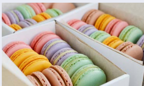
Französische Köstlichkeiten – Macarons ...

Gestärkt, nach einem gemeinsamen Mittagessen, setzen Sie die Fahrt nach Avignon fort. Wer kennt sie nicht, die Brücke Pont Saint-Bénézet, aus dem weltberühmten französischen Volkslied „Le pont d'Avignon“. Heute ist sie ein beliebtes Fotomotiv in wunderschöner Landschaftskulisse am Ufer der Rhône. Statt in Rom residierten die Päpste zwischen 1309 und 1377 in einem festungsartigen Bau in Avignon. Bis 1417 gab es sogar zwei Päpste, einen in Rom und einen weiteren in Avignon, den sogenannten Gegenpapst. Die Stadt war und ist ein beliebter Treffpunkt der Künstler und Kulturschaffenden. Französisches Lebensgefühl, das sogenannte savoir-vivre , begegnet Ihnen hier auf Schritt und Tritt. Erleben Sie das typische Flair der Provence. Nach dem Check-in und Zimmerbezug unternehmen Sie einen ersten orientierenden Rundgang. Der Abend steht Ihnen für eigene Erkundungen zur freien Verfügung.