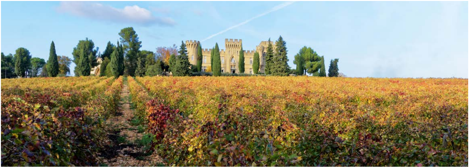
Weinregion um Châteauneuf-du-Pape