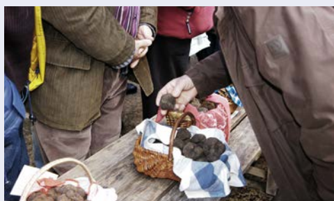
... und Trüffel