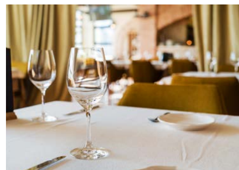
Im Sterne-Restaurant für Sie reserviert.

Am Vormittag erkunden Sie während eines geführten Stadtpaziergangs die malerische Altstadt von Avignon. Herausragend sind die romanische Kathedrale und die Ruine der Brücke Saint-Bénézet, die sich nur noch halb über die Rhône spannt. Das Herz der Stadt bildet der Place de l'Horloge. Anschließend nehmen Sie das gemeinsame Mittagessen in einem sehr guten Restaurant ein. Erleben Sie die Feinheiten der franzö-