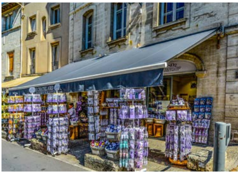
Avignon – Souvenirs aus der Provence