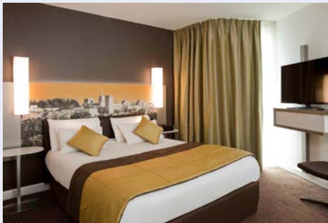
Beispiel – Hotelzimmer

Das Hotel Mercure Cité des Papes (Landeskategorie: 4 Sterne) liegt in unmittelbarer Nähe zum Place de l'Horloge, direkt am berühmten Papstpalast. Aufgrund der optimalen Lage sind zahlreiche Sehenswürdigkeiten schnell zu erreichen. Cafés, Restaurants und viele kleine Geschäfte befinden sich in der Nähe. Alle 73 Zimmer sind komfortabel mit Bad/WC, Fernseher, Telefon und Minibar ausgestattet. Die Zimmer der Kategorie Classic sind etwa 15qm groß und verfügen über ein Doppelbett (160x 200 cm) oder zwei Betten (jeweils 100 x 200 cm). Zimmer der Superiorkategorie sind ca. 21 qm groß und verfügen zusätzlich über ein Einzel-Schlafsofa (auf Anfrage gegen Aufpreis möglich).