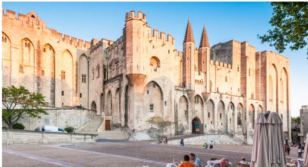
Papstpalast in Avignon

Entdecken Sie während dieser besonderen Reise die unterschiedlichen Genusspfade der französischen Küche. Mit den letzten warmen Sonnenstrahlen im Gepäck, oder im Zauber des Frühlings, erkunden Sie die alte Papststadt Avignon, besuchen die bekannte Weinregion Châteauneuf-du-Pape und erleben einen der bekanntesten Trüffelmärkte Frankreichs im Dorf Richerenches. Immer samstags wird der „schwarze Diamant“ gehandelt. Gelagert im Heck der Autos der Trüffelbauern, transportiert in Plastiktüten und Sporttaschen, ausgebreitet auf Klapptischen, zeigt sich ein zeitweise skurriles „Handelsbild“ in den schmalen Straßen und Gassen. Erleben Sie das ursprüngliche Frankreich, abseits der touristischen Hotspots. Schnell wird bei den Besichtigungstouren deutlich, wie sehr französische Leichtigkeit und mediterraner Esprit das Leben in der Region bestimmen. Gerade in Städten wie Avignon und Aix-en-Provence zeigt sich Südfrankreich von seiner charmantesten Seite.