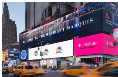
Das New York Marriott Marquis liegt „mittendrin“

Erleben Sie die lebendige Atmosphäre Manhattans im neu renovierten New York Marriott Marquis direkt am Times Square. Das Haus bietet eine perfekte Anbindung zu den Sehenswürdigkeiten der Stadt. Gönnen Sie sich herzhaftes New Yorker Gerichte dank der innovativen Speisekarte in den neu gestalteten Restaurants, zu denen auch der einzige rotierende Speiseraum der Stadt mit Rundumblick auf Manhattan zählt. Entspannen Sie sich in den geräumigen Zimmern, die mit modernen Annehmlichkeiten und einem atemberaubenden Blick auf den Broadway und den Times Square begeistern.