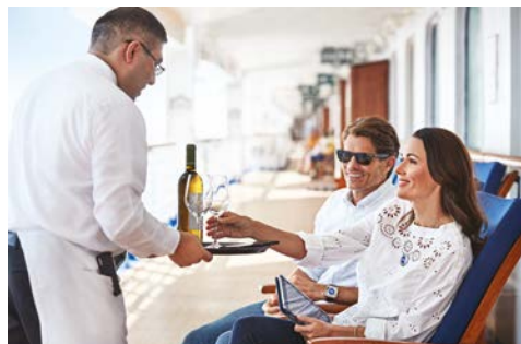
Genießen Sie das Bordleben

Die Bordsprache ist Englisch. Es gibt Menükarten auf Deutsch (auf Anfrage beim Servicepersonal). Die Währung an Bord ist der US-Dollar. Mit Vorlage Ihrer Kreditkarte (Visa, Master Card, Diners Club und American Express) beim Check-In ist kein Bargeld notwendig. Ihre Bestellung bestätigen Sie mit einer Unterschrift und Ihr Bordkonto wird automatisch damit belastet. Trinkgelder an Bord: Während Ihrer Kreuzfahrt werden Sie vom Bordpersonal exzellent betreut. Um allen Mitarbeitern gerecht zu werden, wird eine Trinkgeldempfehlung von ca. 16,- USD (bis Balkonkabine) und von ca. 17,- USD (ab Mini Suite) 18,- USD (Suite) p.P./ pro Nacht auf Ihrem Bordkonto ausgewiesen (vorbehaltlich Änderungen). Die Höhe des Trinkgeldes bleibt selbstverständlich Ihrer persönlichen Entscheidung überlassen. Sie können den Betrag während Ihrer Kreuzfahrt ganz nach Ihrem Ermessen und dem gebotenen Service an Bord nach oben oder unten korrigieren oder komplett streichen. Servicegebühren: Auf alle Getränke in der Bar und im Restaurant sowie auf Anwendungen im Spa-Bereich wird eine obligatorische Servicegebühr von 18 % erhoben. Kleidung an Bord: An Bord ist eine leichte Freizeitbekleidung am Tage und sportlich-elegante Kleidung am Abend empfehlenswert. Badekleidung in öffentlichen Räumen sowie Shorts etc. in den À-la-Carte-Restaurants sollten vermieden werden. Auf dieser Reise finden bis zu zwei formelle Abende statt, an denen entsprechende Kleidung gewünscht wird.