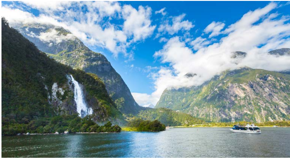
Im wunderschönen Fjordland-Nationalpark

die von bis zu 2723 m hohen, zum Teil steil ansteigenden Bergen, tief ins Land einschneidenden Fjorden, zahlreichen Flüssen und Seen, einem dichten Regenwald und einer fast unberührten und einzigartigen Natur gekennzeichnet ist. Hier sind u.a. auch die berühmten und viel fotografierten Fjorde „Milford“- und „Doubtful Sound“ sowie der größte Fjord des Landes, der Dusky Sound, zu finden. In und an den Fjorden leben u.a. Robben und Pinguine, Neuseeländische Seebären, Große Tümmler, der einzige alpine Papagei, der Kea und viele weitere Tierarten.