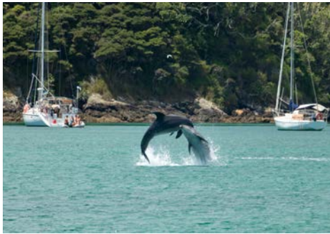
Bay Of Islands

beschreiben. Man muss es gesehen haben. Halten Sie Ihre Kamera bereit – Delfine sind dafür bekannt, völlig aus dem Nichts aufzutauchen.