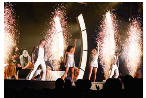
Nicht nur an Land, auch an Bord erwartet Sie Großes!