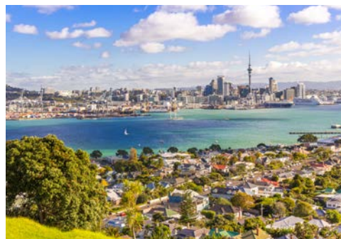
Blick auf Auckland

Willkommen in Auckland, in der „Stadt der Segel“! Nach der Ausschiffung unternehmen Sie eine Besichtigungstour, die Sie zunächst über die Auckland Harbour Bridge in den historischen Vorort Devonport führt. Devonport kann nicht nur mit einem reichen Maori-Erbe und einer langen Seefahrtsgeschichte, sondern auch als Vorreiter glänzen: Es war der erste Vorort an der Nordküste, der Strom erhielt, der erste