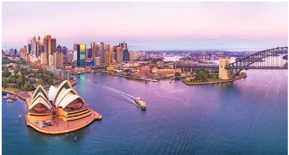
Blick auf Sydney

Entdecker, Natur- und Tier-Freunde aufgepasst – diese Reise entführt Sie ins Reich unter dem Äquator, in eine Welt, die von unglaublicher Flora und Fauna geprägt ist. Eine Welt, in der das Abenteuer noch erlebbar ist. Den Auftakt bildet Australien, genauer gesagt das wunderschöne Sydney. Freuen Sie sich auf zwei Übernachtungen mit ausgiebigen Besichtigungen samt dem berühmten Sydney Opera House. Die ROYAL PRINCESS bringt Sie anschließend nach Neuseeland. Dieses Stückchen Erde gilt als das letzte Land, das je von Menschen besiedelt wurde. Das Gefühl, sich an einem jungen, unverfälschten Ort zu befinden, spürt man überall: ob die unberührten Landschaften, die noch ausgeprägte, einzigartige Flora und Fauna oder die unkomplizierte Lebensart der „Kiwis“, wie sich die Einwohner gerne analog zu ihrem Nationalsymbol nennen. Hier in Neuseeland erlebt man noch wahre Ursprünglichkeit. Eine Besichtigungstour in Auckland rundet Ihre Reise perfekt ab.