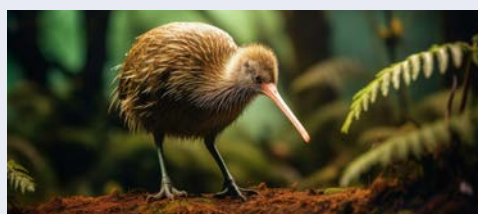
Nationalsymbol Neuseelands – der Kiwi