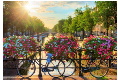
Schönes Klischee in Amsterdam

Genießen Sie nach diesem individuell gestalteten Nachmittag Ihr Abendessen an Bord. Das Schiff liegt über Nacht in Amsterdam. Sie haben somit ausreichend Zeit, die Stadt bei Nacht zu erkunden.