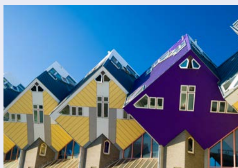
Futuristische Architektur in Rotterdam