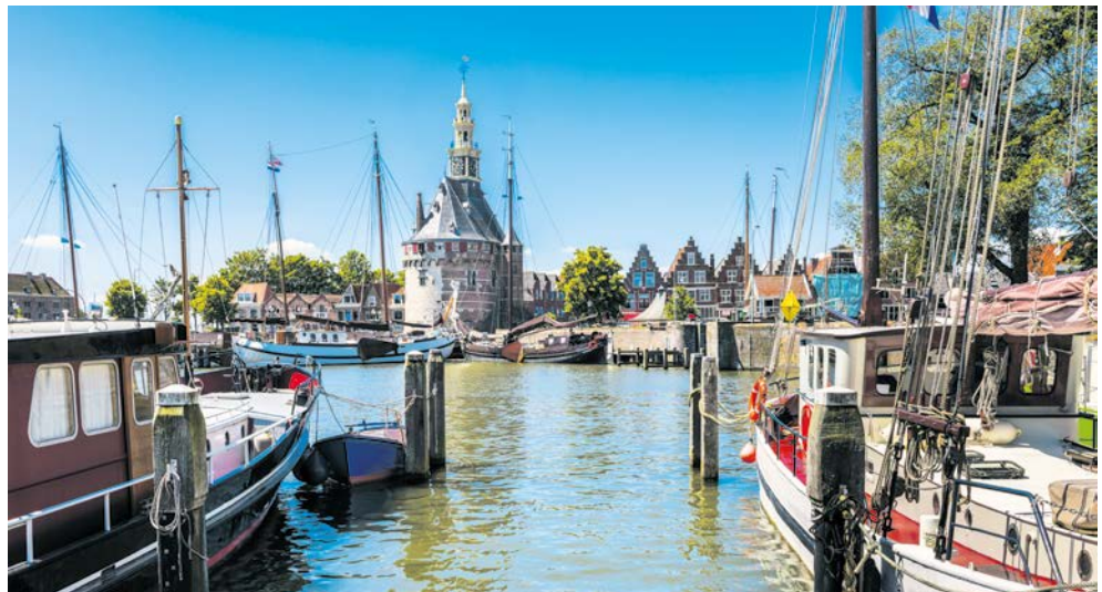
Zauberhafte Kulisse im Hafen von Hoorn