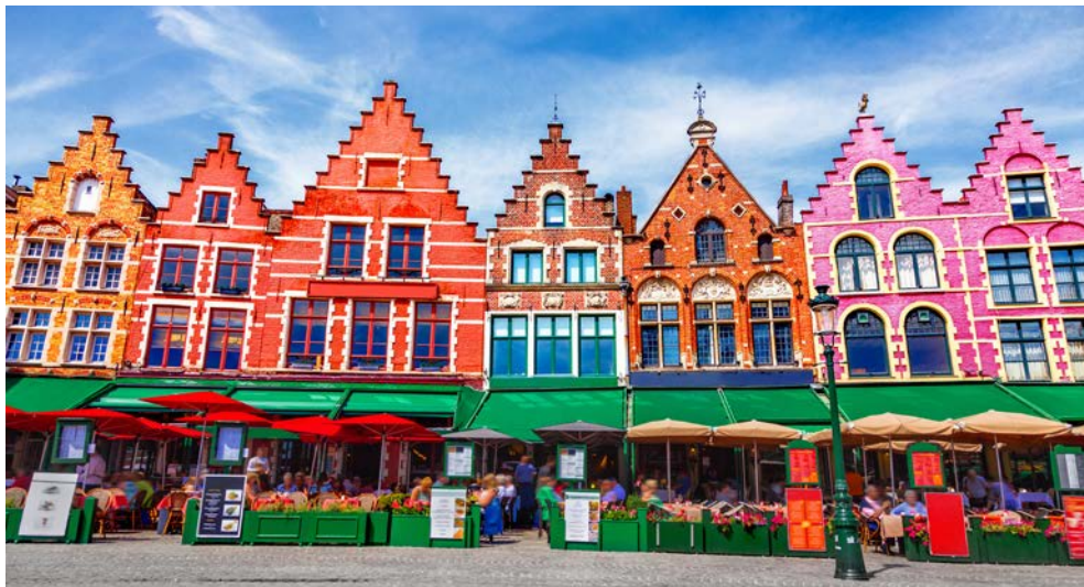
Grote Markt in Brügge