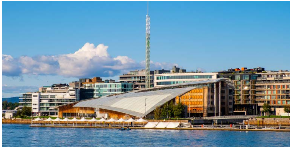
Das Astrup Fearnley Museum

Das neue Nationalmuseum öffnete im Juni 2022 seine Türen. Seitdem zeigt es sowohl ältere als auch moderne Werke, Gegenwartskunst und Design am selben Ort: dem größten Kunstmuseum Skandinaviens. Es bietet eine Dauerausstellung mit rund 5.000 Objekten, die alles von Design, Kunsthandwerk und bildender Kunst aus vielen verschiedenen Jahrhunderten bis hin zu zeitgenössischer Kunst, umfassen. Sie werden chronologisch präsentiert und zeigen Hauptaspekte der norwegischen