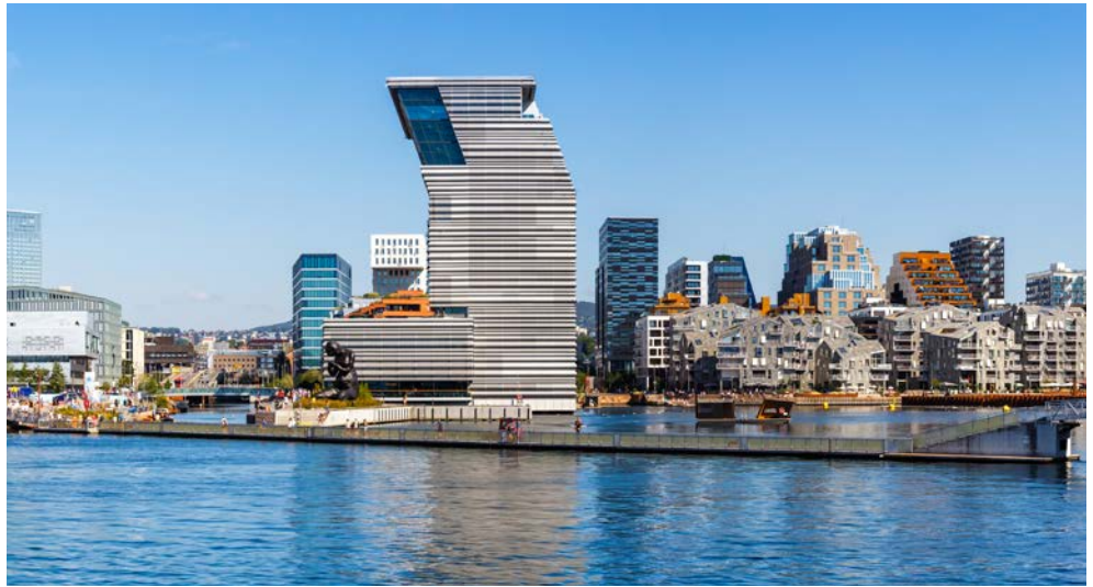
Blick auf das Munch Museum