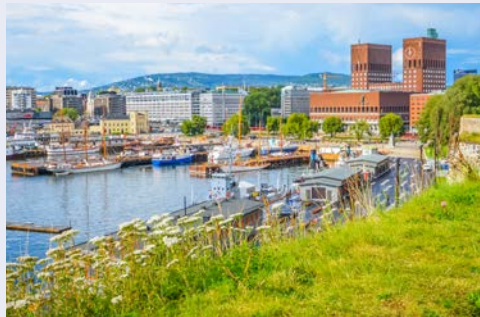
Der Hafen von Oslo mit Blick auf das Rathaus

03.04.-07.04.2025 17.04.-21.04.2025 08.05.-12.05.2025 22.05.-26.05.2025 04.09.-08.09.2025 18.09.-22.09.2025