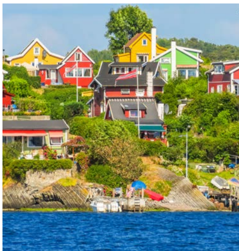
Der idyllische Oslofjord

Ein weiterer Höhepunkt ist der Besuch inklusive Führung im Astrup Fearnley Museum – das Zuhause der Astrup Fearnley Sammlung, einer Sammlung moderner und zeitgenössischer Kunst, die zu den bedeutendsten ihrer Art in Nordeuropa zählt. Im Mittelpunkt steht der Erwerb individueller, innovativer Werke. Ursprünglich dominierten junge amerikanische Künstler, aber nun gehören auch bedeutende Künstler aus Europa, Brasilien, Japan, China und Indien dazu. Wechselnde Ausstellungen ergänzen die Werke der festen Sammlung des Museums. Das Museumsgebäude von 2012 wurde vom italienischen Architekten Renzo Piano entworfen, der für Meisterwerke wie das Centre Georges Pompidou, das Auditorium Parco della Musica und das New York Times Building bekannt ist. Es besteht aus drei Pavillons unter einem markanten Glasdach in Form eines Segels. Das Astrup Fearnley Museum ist vom