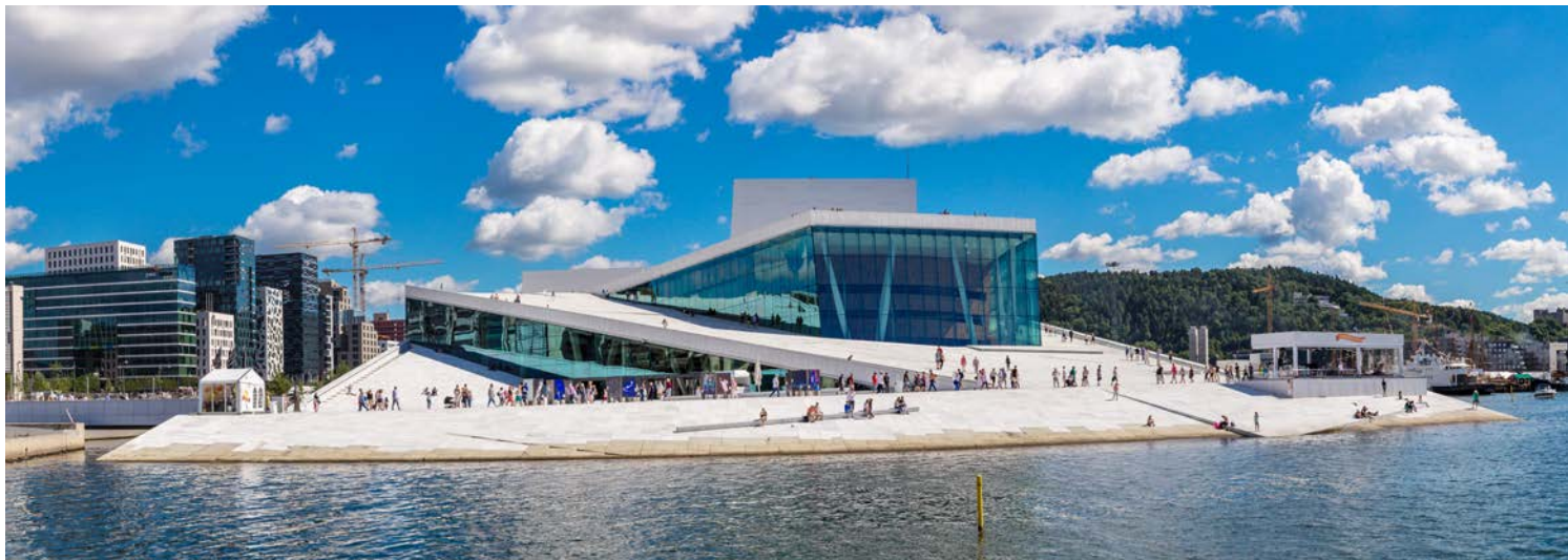
Das spektakuläre Opernhaus

Kunstgeschichte sowie wichtige internationale Werke. Im dunkelblauen Munch-Zimmer kannst du die berühmtesten Gemälde von Edvard Munch betrachten, darunter Der Schrei (1893) und Madonna (1894). Außerdem sind Werke von Künstler*innen wie Harriet Backer, Harald Sohlberg, Christian und Oda Krohg sowie Skulpturen von Gustav Vigeland zu sehen. Von internationalen Künstler*innen stellt das Nationalmuseum unter anderem Werke von Claude Monet, Paul Gauguin, Auguste Renoir, Paul Cézanne und Pablo Picasso aus.