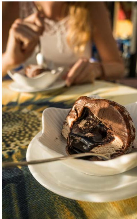
Probieren Sie die italienische Eisspezialität Tartufo di Pizzo

Heute fahren Sie nach Tropea, der antiken römischen Stadt „Tropis“. Dort erwartet Sie eine Stadtbesichtigung mit Besuch der normannischen Kathedrale (12. Jahrhundert), die die heilige Madonna di Romania beherbergt. Besuch des historischen Zentrums mit seinen typischen Gassen. Weiterfahrt entlang der Küste vorbei an Capo Vaticano. Nach einer Reihe von Postkarten-Landschaften erreichen Sie den berühmten Leuchtturm, wo Sie eine der schönsten Aussichten in Kalabrien erwartet. Bewundern Sie die Klippen und Buchten des Capo Vaticanos mit Blick auf die Äolischen Inseln. Ca. 15 km (F, A)