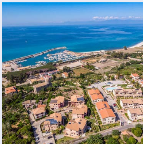
Panoramablick über den Hafen vom Hotel