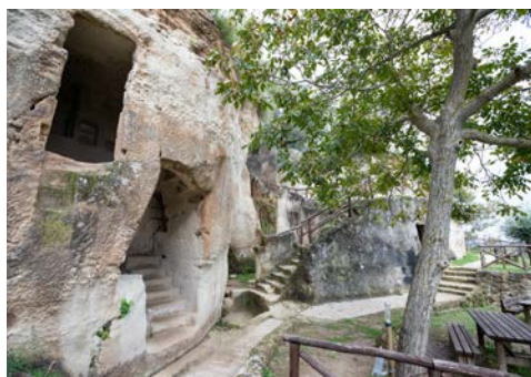
Die Höhlen von Zungri

Dieser Ausflug führt Sie ins Landesinnere Kalabriens. Sie erreichen Zungri, ca. 570 m über dem Meeresspiegel auf der Nordseite der Hochebene von Poro gelegen und einer der interessantesten, landwirtschaftlichen Orte der Region. Die einfache Architektur des historischen Stadtkerns stellt das