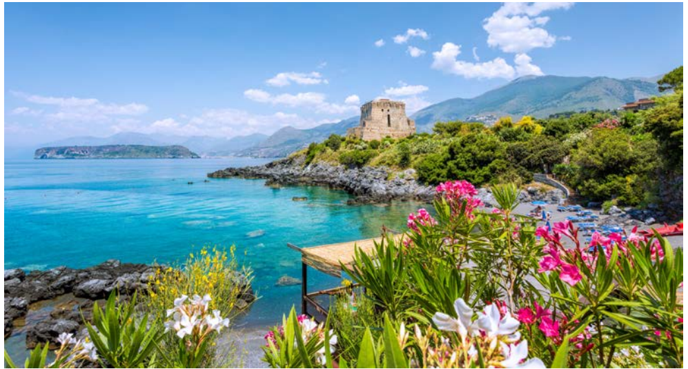
Herzlich willkommen in Kalabrien

Kalabrien liegt an der Spitze des italienischen Stiefels am südlichsten Punkt Italiens. Das angenehme Klima, die wunderschönen Farben des Meerwassers, die von Sandstränden unterbrochenen felsigen Küsten, die wilde, geheimnisvolle Landschaft, der deftige und unverfälschte Geschmack der heimischen Küche und die Zeugnisse der antiken Vergangenheit machen Kalabrien zu einem einzigartigen Landstrich, fernab vom Massentourismus. Hier geht jeder Wunsch in Erfüllung