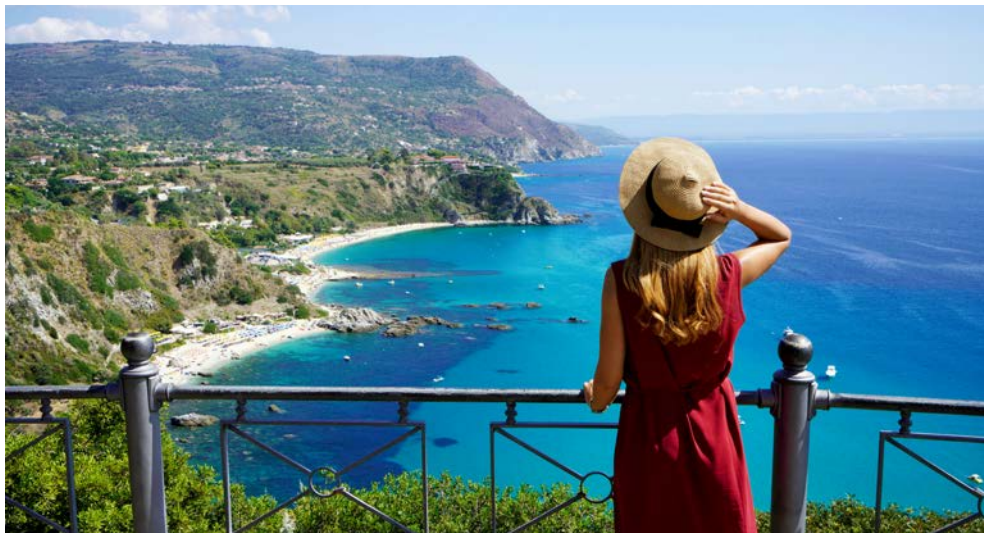
Fantastische Aussichten vom Capo Vaticano