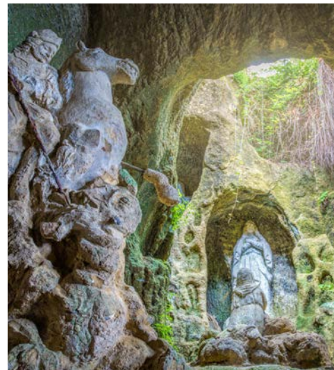
Pizzo, Höhlenkirche Piedigrotta

einäugigen Zyklopen die Waffen der Götter schmiedet. Der Schwefelgeruch, der über die Insel zieht, ist sehr markant. Er wird von den zahlreichen Fumarolen der Insel erzeugt. (F, A)