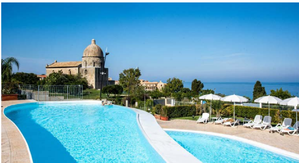
Pool Ihres Hotels mit Aussicht