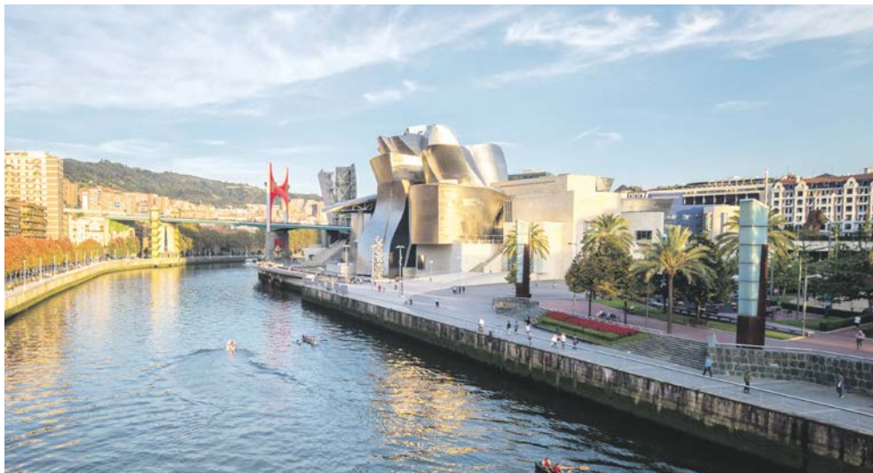
Das berühmte Guggenheim Museum in Bilbao

Hotel zum berühmten Guggenheim-Museum. Das von Frank O'Gehry entworfene Gebäude aus Stahl, Glas, Kalkstein und Titan hat der einstigen Industriestadt am Atlantik ein völlig neues Image gegeben. Direkt am Fluss in der neuen Gegend von Abandoibarra beherbergt das 1997 eröffnete Guggenheim-Museum auf 24.000 m 2 je nach Jahreszeit verschiedene und interessante Wanderausstellungen zeitgenössischer, moderner aber auch klassischer Kunst. Hier können Sie z. B. die Werke von Kandinsky, Marc Chagall, Henri Matisse, Paul Klee, Salvador Dalí, Joan Miró und Juan Gris, Mark Rothko, Anselm Kiefer etc. bewundern. Außerdem sind die permanente Ausstellung mit Skulpturen/Kunstwerken von Richard Serra „The Matter of Time“ sowie die Skulpturen von Jeff Koons und Louise Bourgeois zu sehen. Die Tour endet nach ca. 4 Stunden. Der Nachmittag steht Ihnen zur freien Verfügung.