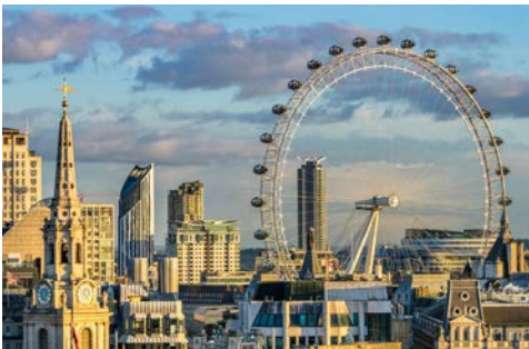
Das London Eye

Poole besitzt den größten Naturhafen der Welt und ist stolz auf seine preisgekrönten Strände. Das Hafenstädtchen ist Ihr Tor nach Dorset. Die schöne Landschaft der Grafschaft dürfte so manchem aus Rosamunde Pilcher-Filmen bekannt sein – mit Steilküsten, alten Burgen und modernen Seebädern.