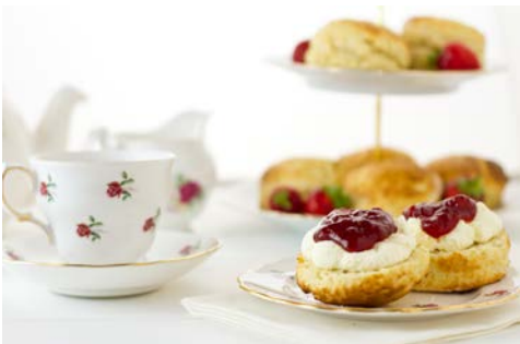
Eine klassische „Tea Time“ dürfen Sie nicht verpassen