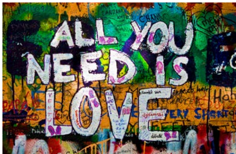
Auf den Spuren der Beatles in Liverpool

Sehenswürdigkeiten. Während einer möglichen Stadtrundfahrt gibt es viel zu sehen, unter anderem das Trinity College mit dem berühmten „Book of Kells“, St. Patrick's Kathedrale und das Parlamentsgebäude. Machen Sie Halt in einem der zahlreichen Pubs, trinken Sie ein sämiges Guinness, und gönnen Sie sich einen Moment der Ruhe in dieser lebendigen Stadt.