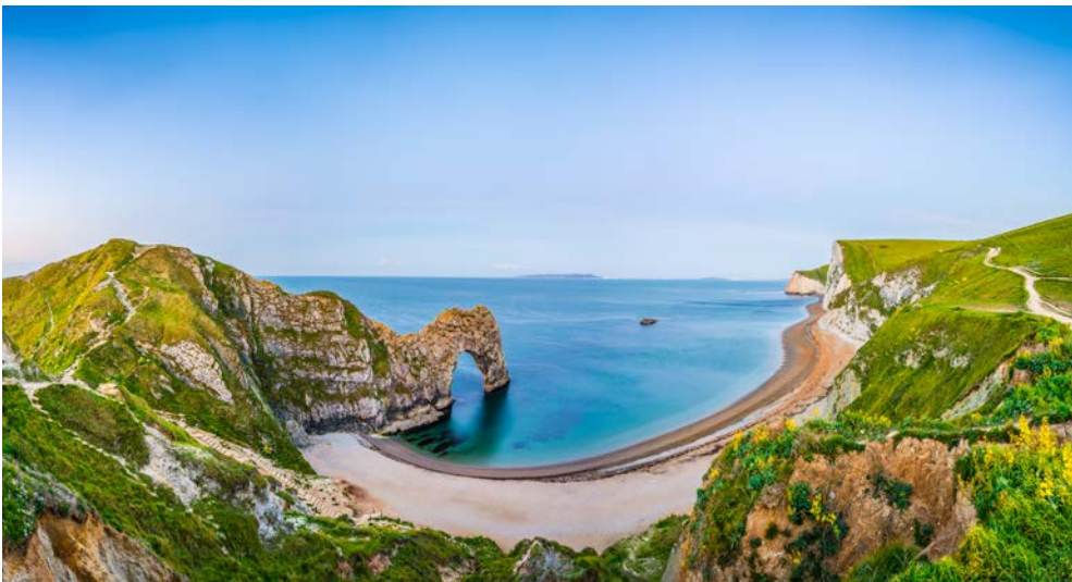
Jurassic Coast in der Grafschaft Dorset – traumhafte Felsformationen und herrliche Strände