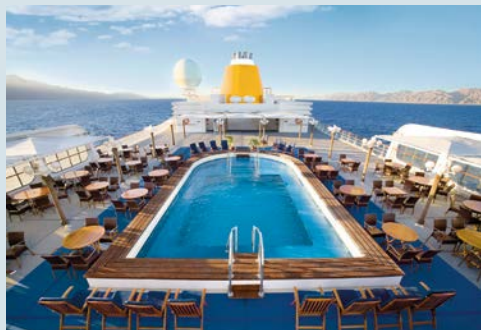
Entspannte Zeiten an Deck