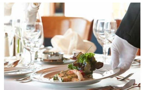
Lassen Sie sich verwöhnen!