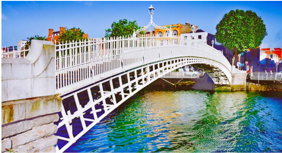
Half Penny Bridge in Dublin