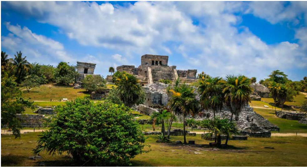
Beeindruckend: Maya Ruine auf Cozumel