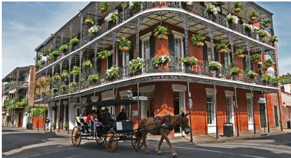
French Quarter in New Orleans