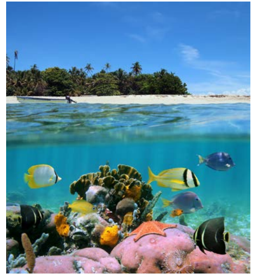
Roatán – traumhafte Unterwasserwelten

Nach der Ausschiffung in Galveston fahren Sie gemeinsam mit Ihrem englischsprachigen Reiseleiter nach Houston. Dort lernen Sie auf einer