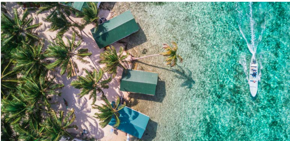
Traumstrände in und vor Belize erwarten Sie

Zwischen Playa del Carmen und Belize auf der Halbinsel Yucatan am Golf von Mexiko gelegen, erscheint Costa Maya seit der Herrschaft der Maya völlig unberührt. Traumhaftes türkisfarbenes Meer, feinsandige Traumstrände und ursprünglicher Dschungel werden Sie in ihren Bann ziehen.