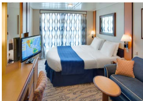
Kabinenbeispiel mit Balkon

Wir bitten Sie zu beachten, dass Spezialitätenrestaurants, verschiedene Serviceangebote und Bordeinrichtungen nur gegen Gebühr und Reservierung möglich sind. Einen detaillierten Deckplan und Informationen zu Sitzplatzreservierungen für die Deutsche Bahn erhalten Sie im Internet unter der unten angegebenen Adresse.