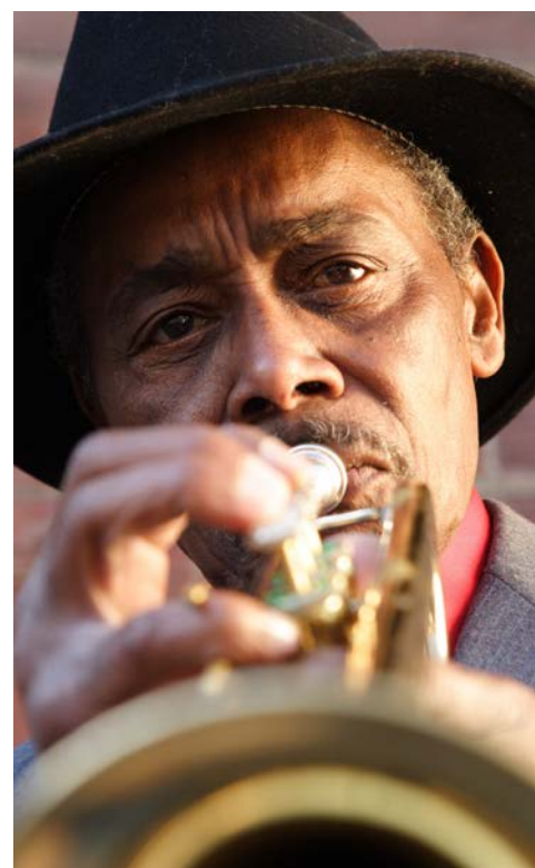
Willkommen in den „swinging“ Südstaaten

Nach dem Frühstück brechen Sie auf Richtung Galveston, wo Sie im Hotel einchecken. Hier gibt es ein wenig Zeit zur freien Verfügung, wo Sie die vielen Eindrücke der letzten Tage noch einmal Revue passieren lassen können.