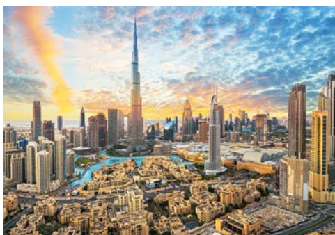
Beeindruckend – die Skyline von Dubai

untergebracht ist, ist von alten Bastakiahäusern (den Häusern der Kaufleute) umgeben, welche Dubais reiche Vergangenheit in den aufwendigen Windtürmen widerspiegeln. Die Abras oder Wassertaxis haben die Jahrhunderte überdauert, ungeachtet der vielen modernen Hochhäuser, die wie Pilze aus dem Boden schießen. Mit all seinen Glaspalästen, Geschäfts- und Wohnhäusern und Einkaufszentren ist Dubai eine Stadt, die ihren eigenen individuellen Charme hat.