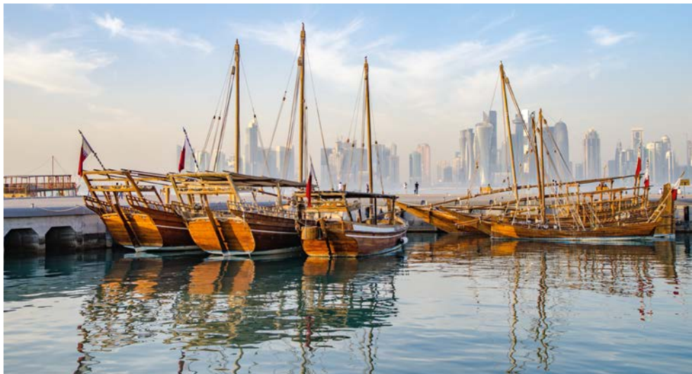
Typische Dhow Schiffe

untergebracht ist, ist von alten Bastakiahäusern (den Häusern der Kaufleute) umgeben, welche Dubais reiche Vergangenheit in den aufwendigen Windtürmen widerspiegeln. Die Abras oder Wassertaxis haben die Jahrhunderte überdauert, ungeachtet der vielen modernen Hochhäuser, die wie Pilze aus dem Boden schießen. Mit all seinen Glaspalästen, Geschäfts- und Wohnhäusern und Einkaufszentren ist Dubai eine Stadt, die ihren eigenen individuellen Charme hat.