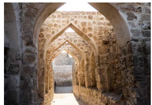
Fort von Bahrain

Bahrain, ein kleines Königreich im Persischen Golf, bietet eine faszinierende Mischung aus Kultur, Geschichte und Moderne. Besuchen Sie zum Beispiel die beeindruckende Al Fateh Grand Moschee in Manama, gefolgt von einem Abstecher ins Bahrain National Museum, um mehr über die reiche Geschichte des Landes zu erfahren. Ein Spaziergang durch den Bab el-Bahrain Souk bietet die Möglichkeit, traditionelle Handwerkskunst und Gewürze zu entdecken und lokale Spezialitäten zu probieren.