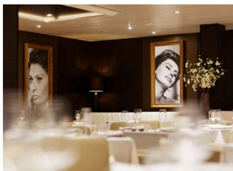
Genießen Sie die Zeit an Bord!