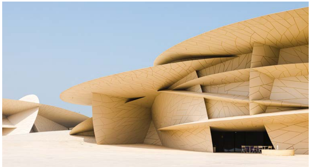
Katarisches Nationalmuseum in Doha