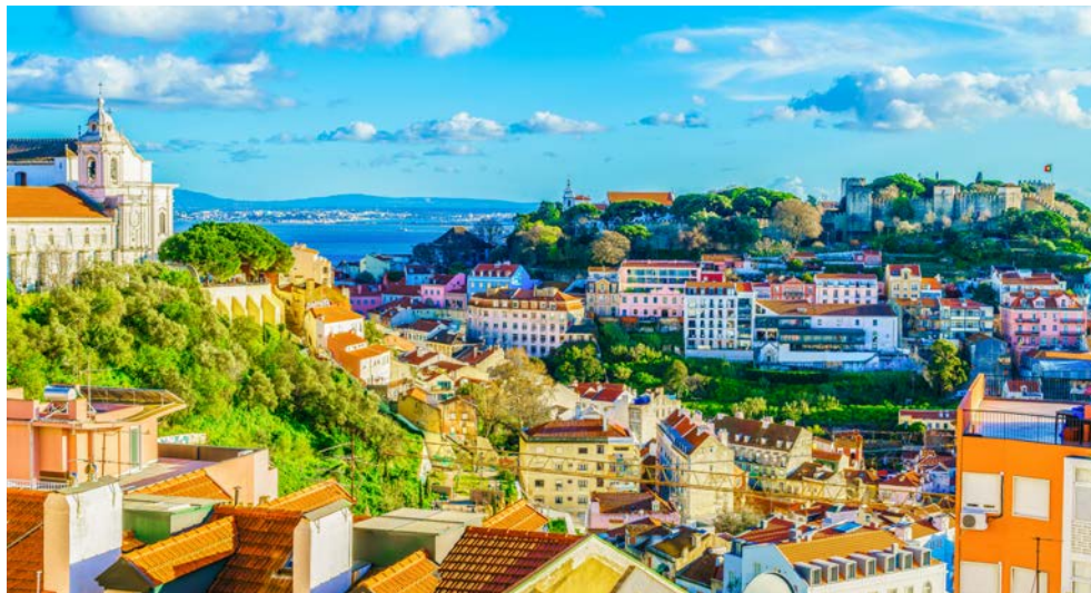
Die Altstadt von Lissabon

Verbringen Sie zu Beginn dieser schönen Reise zwei Tage in Lissabon und lernen Sie die Hauptstadt Portugals bei einer ausführlichen Stadtrundfahrt inklusive Besuch des Jeronimos Klosters kennen. Im Anschluss geht es für Sie auf eine 16-tägige Kreuzfahrt mit der VASCO DA GAMA. Entdecken Sie jeden Tag eine neue Welt, ohne den Kontinent wechseln zu müssen. Diese Kreuzfahrt entlang der Westküste Europas auf der VASCO DA GAMA macht es möglich! Nachdem Sie Lissabon verlassen haben, erreichen Sie das Portwein-Mekka Porto. Weiter geht es zur Kunst-Hochburg Bilbao und dem Rotwein-Zentrum Bordeaux. Hierauf machen Sie Halt an der beeindruckenden Festung von Saint-Malo, stoppen am malerischen Künstlerort Honfleur und besuchen die Weltmetropolen London und Amsterdam. In Bremerhaven gehen Sie dann wieder von Bord, mit einer Menge Erinnerungen im Gepäck.