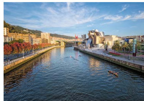
Willkommen in Bilbao

Historische Bauwerke wie der Revillagigedo Palast, bezaubernde lokale Festivals und ein abwechslungsreicher botanischer Garten erwartet Sie in der spanischen Hafenstadt Gijón!