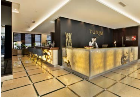
Empfangsbereich des Turim Marques Hotel