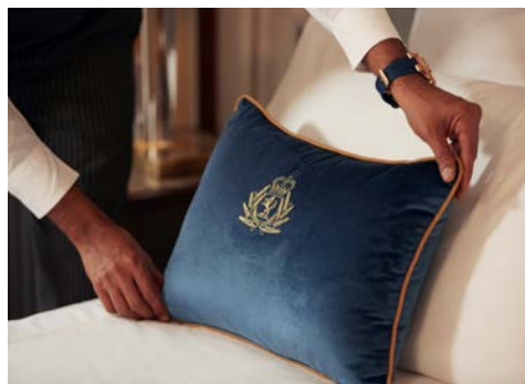
Willkommen an Bord

Heute beginnt Ihre Reise mit der Einschiffung auf die QUEEN MARY 2. Dann heißt es „Leinen los“ und Sie genießen die Ausfahrt aus dem heimlichen Heimathafen Ihres Schiffes, vom Sonnendeck aus, mit dem regen Schiffsverkehr und den hübschen Flussufern.