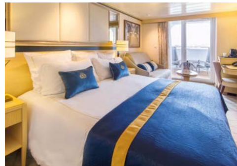
Balkonkabine – Beispiel

Einen detaillierten Deckplan und Informationen zum Schiff erhalten Sie im Internet unter der unten angegebenen Adresse.