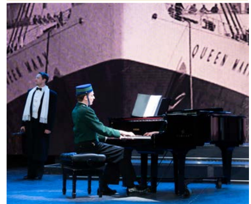
Royal Shakespeare Company

Auf dieser besonderen Kreuzfahrt können Sie sich übrigens auf exklusive Theaterszenen der Royal Shakespeare Company und deren klassische Darbietungen auf der Bühne und auf der Leinwand freuen sowie an Workshops und Fragerunden teilnehmen.