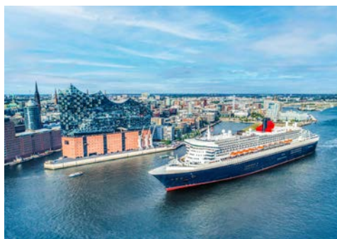
Die QUEEN MARY 2

Einzelkabinen/-zimmer ab € 1.779,- und weitere Kategorien auf Anfrage buchbar. Sie erhalten Ihre Kabinennummer mit den Reiseunterlagen.