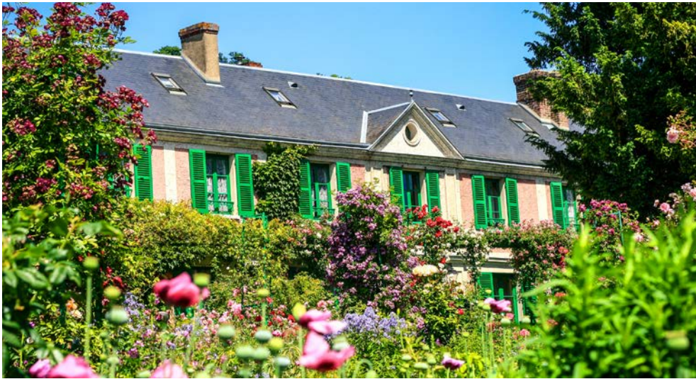
Giverny – das Haus von Claude Monet