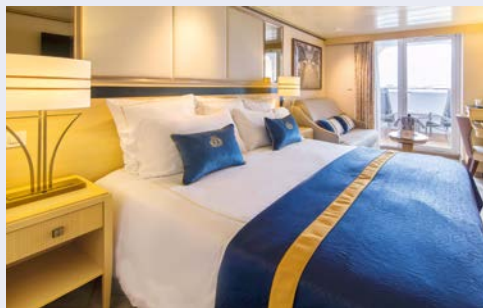
Balkonkabine – Beispiel

Mit der QUEEN MARY 2 erleben Sie Kreuzfahrt nach bester Seefahrertradition – Eleganz im Stil der klassischen Ocean Liner kombiniert mit Komfort, Moderne und Perfektion. Erleben Sie an Bord der QUEEN MARY 2 erholsame Urlaubstage mit vielfältigen, sportlichen und kulturellen Unterhaltungsmöglichkeiten sowie erstklassigen Service. Urlaub könnte nicht schöner sein! Freuen Sie sich u.a. auf einen spektakulären Ausblick auf den Sternenhimmel im einzigen Planetarium der Weltmeere, auf ein ausgewähltes Unterhaltungsprogramm wie Konzerte und Shows im Royal