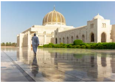
Die Große Moschee in Maskat

nicht gespart: Die Sheikh Zayed Moschee ist das weltweit drittgrößte islamische Gotteshaus – mit der größten Moscheekuppel überhaupt. Sie ist über 70 m hoch und spannt sich über 32 m.