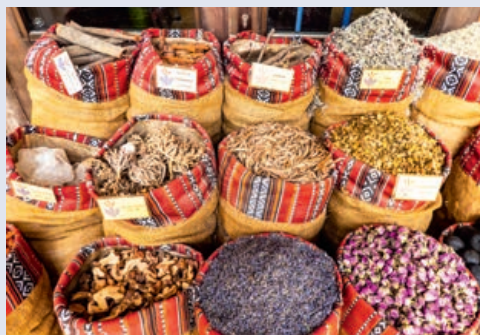
Gewürze in den Souks