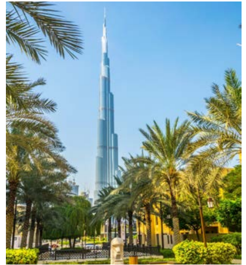
Das höchste Gebäude der Welt: der Burj Khalifa mit 828 m