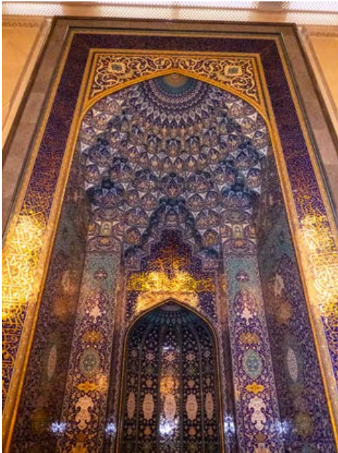
In der Großen Sultan-Qabus Moschee

nicht gespart: Die Sheikh Zayed Moschee ist das weltweit drittgrößte islamische Gotteshaus – mit der größten Moscheekuppel überhaupt. Sie ist über 70 m hoch und spannt sich über 32 m.