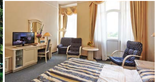
Health Spa Hotel - Ensana Pacifik, Zimmerbeispiel