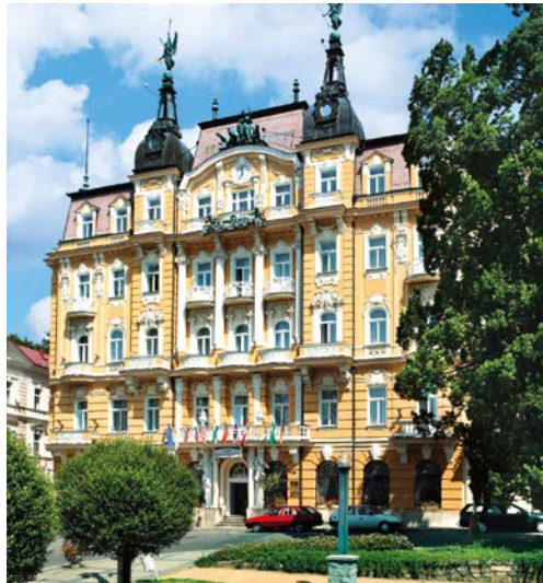
Health Spa Hotel - Ensana Pacifik