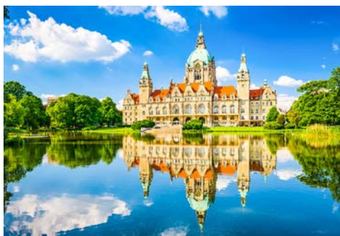
Neues Rathaus in Hannover

Ob gotische Hansestadt, einstige königliche Residenzhauptstadt, wilhelminische Industriestadt des Nordens oder moderne Landeshauptstadt – die wechselvolle Geschichte prägt Hannovers Stadtbild. Die Stadtentwicklung begann mit einem Dorf an der Leine, erhielt Stadtrechte mit eigenem Münzrecht, erfuhr einen Aufstieg zur Residenzstadt und wurde am Ende Hauptstadt des Bundeslandes Niedersachsen. Viele Künstler und Wissenschaftler lebten und wirkten in Hannover, wie der Philosoph Leibniz und der Komponist Händel. Aus der jüngeren Vergangenheit erfahren Sie über die Hannoveraner, die sich in der Welt einen Namen machten: Emil Berliner erfand das Grammophon und die Schallplatte, Anfang der 60er Jahre entwickelte Professor Walter Bruch in Hannover das PAL-Farbfernseh-System und seit über hundert Jahren wird hier der Leibniz-Keks von Bahlsen gebacken. Es gibt in Hannover daher kulturhistorisch viel zu entdecken: Das Neue Rathaus, die malerische Altstadt und die barocken Herrenhäuser Gärten sind nur einige Highlights dieser Stadtbesichtigung, wenn Sie daran teilnehmen mögen.