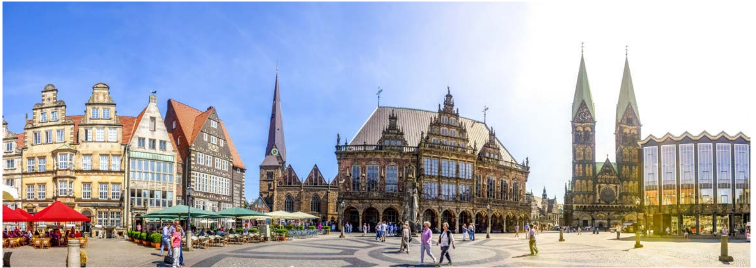
Vom Anleger aus sind es nur wenige Schritte zum Marktplatz – willkommen in der Hansestadt Bremen!