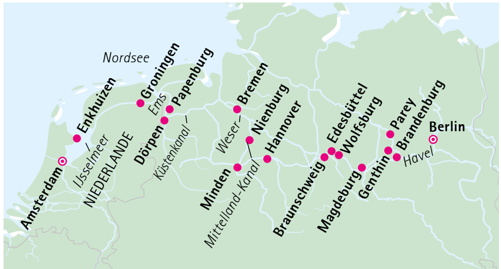
Ihre Reiseroute – es gibt viel zu entdecken!

Einige Stopps dienen nur der Ausflugsabwicklung