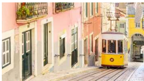
Auf und ab in Lissabon!

Lassen Sie die Seele baumeln! Schlendern Sie über das Deck, gönnen Sie sich ein Eis zwischendurch und atmen Sie die frische Meeresbrise ein - herrlich!