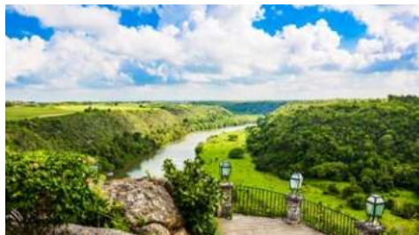
Blick auf den Chavón

Heute unternehmen Sie einen exklusiven Ausflug nach La Romana. Die viertgrößte Stadt an der Südküste der Dominikanischen Republik bietet Besuchern eine Vielzahl von einzigartigen Erlebnissen. Für Sie steht heute der Besuch einer Zigarrenfabrik auf dem Programm. Es ist beeindruckend zu sehen, wie viel Handarbeit noch heute in jede Zigarre fließt. Anschließend geht es weiter nach Altos de Chavón, ein malerisches Dorf mit Blick auf den Chavón-Fluss. Gebaut im mediterranen Stil des 16. Jh., wurde es erdacht um nationale Kunst und Kultur zu fördern und zu bewahren. Auch die entspannte Flussfahrt auf dem Chavón-Fluss wird Ihnen sicher gut gefallen. Genießen Sie die üppig tropische Vegetation und die friedliche Atmosphäre des Flusses. Ihr Mittagessen nehmen Sie in einem Beach Club in Bayahibe ein, einem malerischen Küstendorf, das für seine wunderschönen Strände bekannt ist. Den Abschluss des Tages bildet ein Besuch der beeindruckenden Basilica Nuestra Señora de la Altigracia in Higüey, eines der meistbesuchten Heiligtümer in der Karibik.