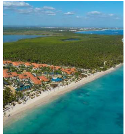
Traumhafte Lage Ihres Hotels

Schließen Sie die Augen und stellen Sie sich das glitzernde, türkisfarbene Meer vor, das mit sanftem Rauschen auf einen endlos erscheinenden, weißen Sandstrand trifft. Die Palmen wiegen sich leicht im Wind, der Himmel erstrahlt und die Sonne leuchtet satt – willkommen in der Karibik! Freuen Sie sich auf einen herrlichen Auftakt in der Dominikanischen Republik. In Punta Cana verbringen Sie drei Nächte in einem erstklassigen Hotel mit fantastischem All-Inclusive Angebot und erleben einen exklusiven Tagesausflug nach La Romana. Anschließend begrüßt Sie die Mein Schiff 2 . Sie gleiten zu den karibischen Perlen Martinique, Barbados und St. Vincent. Ihre ständigen Begleiter: Die schillernden Farben und die sanfte Meeresbrise der Karibik. Genussvolle Seetage mit den Mein Schiff® Premium-Inklusivleistungen versprechen unvergessliche Momente auf Ihrem Weg zu den Azoren und weiter zum portugiesischen Festland. Vom spanischen La Coruña aus vielleicht noch einen Abstecher auf dem Jakobsweg, bevor Sie in Bremerhaven einlaufen – was für eine fantastische Reise!