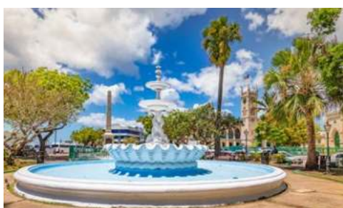
Im Zentrum von Bridgetown