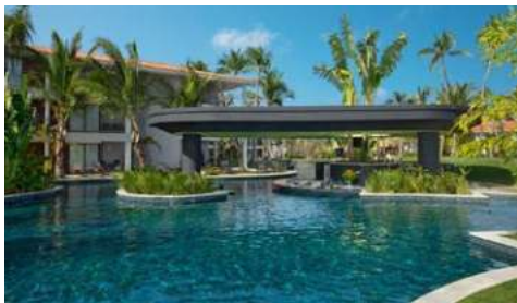
Poolbereich Ihres Hotels

Das Dreams® Flora Resort & Spa liegt perfekt an einem palmengesäumten Strand in Punta Cana. Eingebettet in eine wunderschöne, natürliche Vegetation bietet dieses All-Inclusive-Refugium luxuriös ausgestattete Zimmer. Speziell für Sie haben wir die Junior Suite mit Doppel-Swim- Up-Bett reserviert. Von dieser 53 m 2 großen Junior Suite erreichen Sie direkt den Pool über eine kleine Terrasse. Im Inneren finden Sie zeitgenössisches Dekor, zwei Queensize- Betten, ein Schlafsofa, ein geräumiges Badezimmer mit Regendusche und eine wunderschöne Aussicht auf einen üppigen, tropischen Garten. Im Dreams Flora Resort & Spa erwartet Sie ein unvergesslicher Unlimited-Luxury®-Urlaub. Das Resort erwartet Sie mit exzellenter Kulinarik und mit modernem, karibisch inspiriertem Dekor.