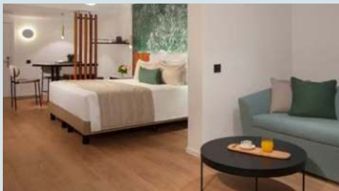
Zimmerbeispiel Ihres Hotels

Bitte beachten Sie: Für die Flüge und Bahnfahrten gilt: Um- steigeverbindungen möglich; Flüge in der Economy Class; Bahnfahrten mit Sitzplatzreservierung. Für die Bustransfers gilt: Bei Nichterreichen der Mindestteilnehmerzahl (sofern oben nicht anders genannt) von je 10 Personen pro ge- nanntem Zustiegsort behalten wir uns eine alternative An- und Abreise vor; Umsteigeverbindungen möglich.