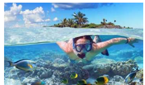
Die karibische Unterwasserwelt lädt zum Schnorcheln ein

Auf Barbados können Sie klassische Karibikfreuden genießen. Das türkisblaue Meer lädt zum Schnorcheln ein – mit etwas Glück können Sie hier sogar mit Schildkröten schwimmen – und die Strände bieten das perfekte Ambiente für einen paradiesischen Tagtraum. Doch auch ein Ausflug in die Vergangenheit ist möglich: Im historischen Teil von Bridgetown befindet sich das britische Garnisonengelände aus Kolonialzeiten, das 2011 zum UNESCO Weltkulturerbe ernannt wurde.