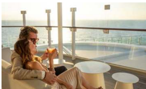
Das Leben genießen, an Bord von Mein Schiff ® ein Leichtes

Traumhafte Tage der Muße liegen vor Ihnen. Schlafen Sie aus und schlemmen Sie gemütlich am Buffet, gehen Sie eine Runde schwimmen oder genießen Sie ein wenig Wellness - der Zugang zum Saunabereich ist in den Mein Schiff ® Inklusivleistungen bereits enthalten. Nutzen Sie eines der vielfältigen Sportangebote, bevor Sie die nächste kulinarische Köstlichkeit probieren oder gehen Sie shoppen. Hier an