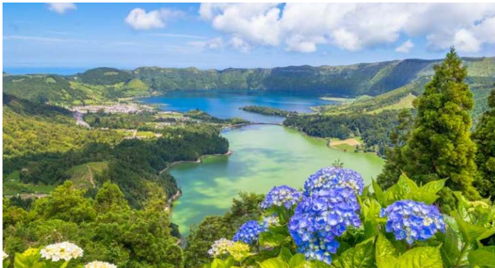
Auch São Miguel wird Sie verzaubern