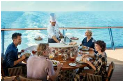
Herzlich willkommen an Bord

Die Mein Schiff 2 wird Sie begeistern. Gestalten Sie Ihren eigenen Wohlfühltag an Bord wie es Ihnen gefällt. Frühstück à la carte, eine entspannende Massage im SPA & Meer Bereich, anschließend eine Runde auf dem Jogging- deck mit grandiosem Blick auf den weiten Horizont – herrlich. Die Mein Schiff® Premium-Inklusivleistungen runden Ihren perfekten Wohlfühltag ab – es ist viel mehr im Reisepreis inbegriffen als gedacht! Kleidung: An Bord gibt es keinen formellen Dresscode. Mit klassisch legerer Kleidung liegen Sie auf jeden Fall immer richtig. Kleider- empfehlung: Mit klassisch-legerer Kleidung liegen Sie immer richtig.