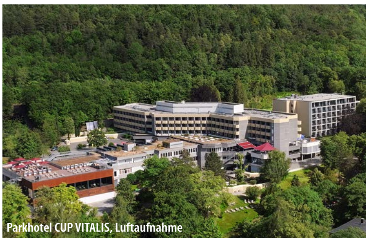
Parkhotel CUP VITALIS, Luftaufnahme