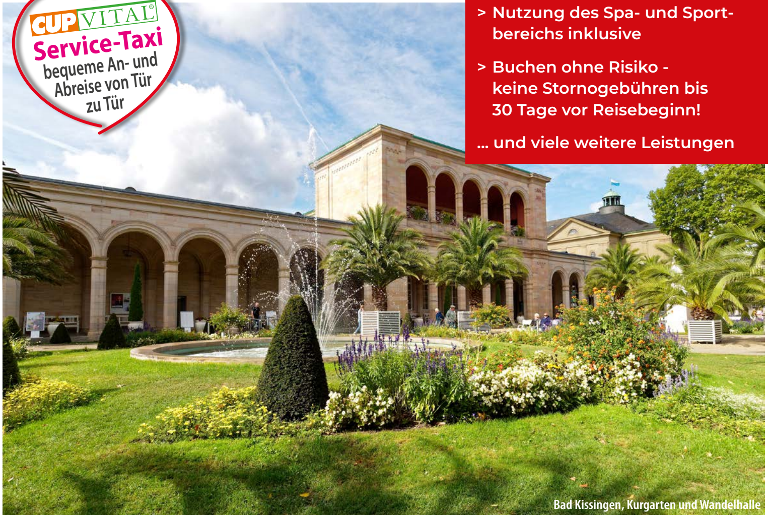
Bad Kissingen, Kurgarten und Wandelhalle