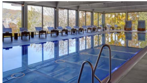
Schwimmbad mit 20 m Sportbecken

Aktivieren Sie neue Kräfte in der professionellen Sporthalle sowie im Fitnessstudio auf 150 m 2 mit modernsten Geräten.