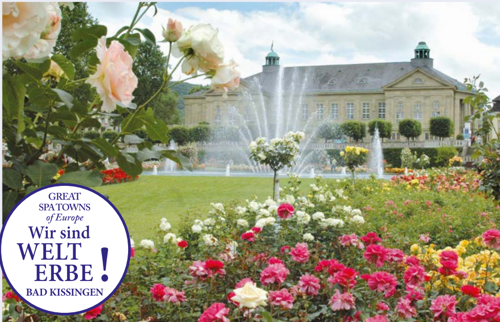
Bad Kissingen, Rosengarten vor dem Regentenbau

GREAT SPA TOWNS of Europe Wir sind WELT ERBE! BAD KISSINGEN