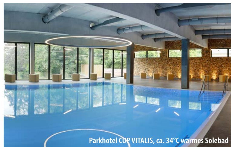
Parkhotel CUP VITALIS, ca. 34°C warmes Solebad