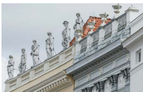
Figuren auf dem Drägerhaus