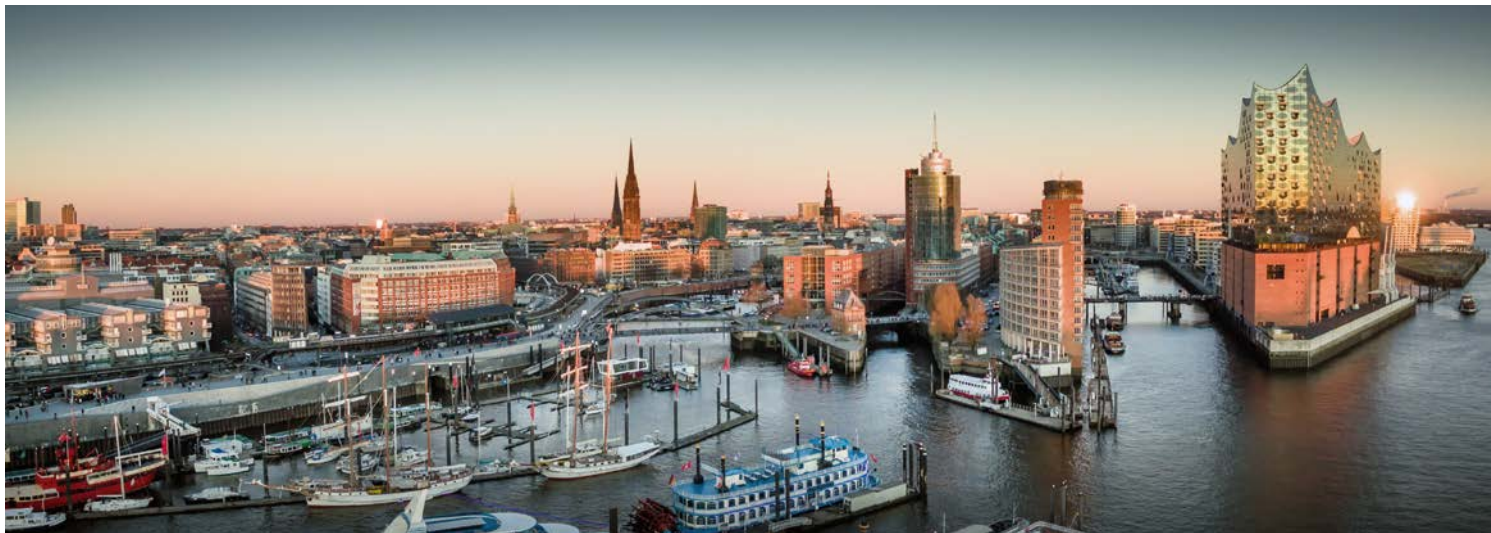
Freuen Sie sich auf das Konzert in der Elbphilharmonie