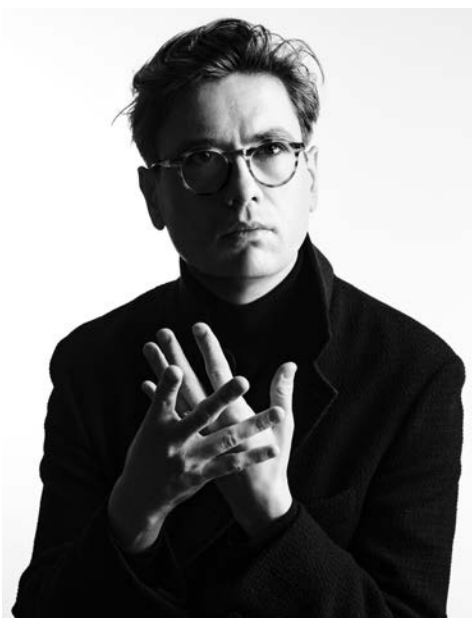
Vikingur Ólafsson in der Elbphilharmonie

Konzerthaus gehen. Auf dem Sockel des ehemaligen Kaispeichers an der westlichen Spitze der Hafencity erhebt sich der gläserne Neubau mit seiner kühn geschwungenen Dachlandschaft. Er birgt zwei Konzertsäle, ein Hotel und Appartements. Im Großen Saal erleben Sie ab 20 Uhr das Tonhalle-Orchester Zürich und Vikingur Ólafsson unter der Leitung von Paavo Järvi. Brahms mal zwei heißt es in dieser Saison für den isländischen Ausnahmepianisten Vikingur Ólafsson: Nach seiner Reise um die Welt mit Bachs Goldberg-Variationen hat er sich in dieser Saison beide Klavierkonzerte von Johannes Brahms vorgenommen – mit unterschiedlichen Partnern an seiner Seite. Auf den Auftakt mit dem London Philharmonic Orchestra im November, folgt im März die Fortsetzung mit dem Tonhalle-Orchester Zürich und dem großsinfonisch angelegten Zweiten Klavierkonzert. Als schwungvolle Ergänzung steuert das Orchester Schumanns »Rheinische« Sinfonie bei – ein Paradedstück für den Edelklangkörper aus der Schweiz und seinen energiegeladenen Chefdirigenten Paavo Järvi. Man hört den fröhlich dahinströmenden Klängen dieser Sinfonie den Motivationsschub an, den der Umzug von Leipzig nach Düsseldorf am Rhein für den Komponisten bedeutete. Nach dem Konzert bringt Sie der Bus zurück in Ihr Hotel nach Lübeck.