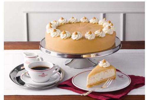
Freuen Sie sich auf Marzipan-Kreationen von Niederegger

Im Anschluss schauen Sie bei Niederegger vorbei. Im Jahre 1806 wurde das Unternehmen vom Konditormeister Johann Georg Niederegger gegründet und bis heute genießt das Niederegger Marzipan einen hervorragenden Ruf in der ganzen Welt. Gemeinsam mit Frau Klockmann besichtigen Sie den Marzipan-Salon mit seinen lebensgroßen Figuren, bevor man Ihnen ein Mittagessen serviert. Im Anschluss haben Sie Zeit für eigene Erkundungen in der Innenstadt oder einer Pause im Hotel.