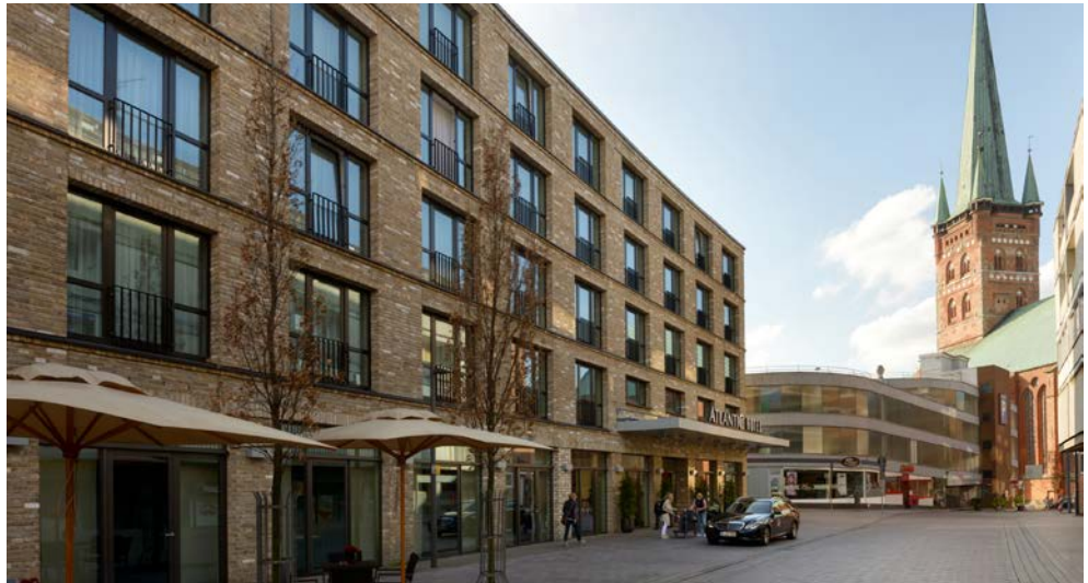
Das ATLANTIC Hotel Lübeck