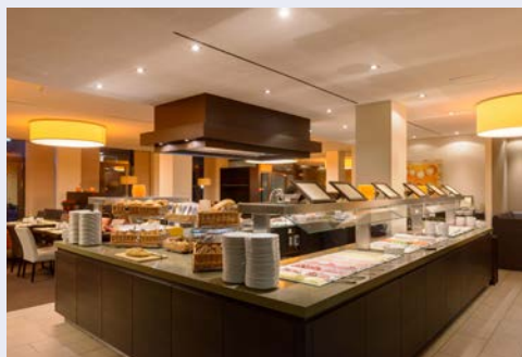
Genießen Sie Ihr Frühstück