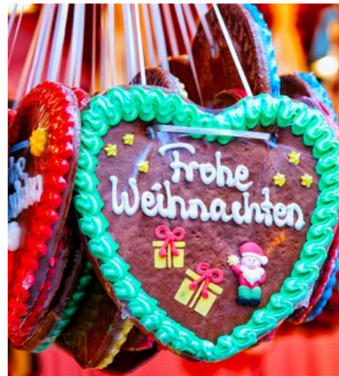
Auf dem Weihnachtsmarkt

des Prinzipalkommissars und das des Generalpostmeisters. Für den Verlust wurden sie vom Bayerischen Königreich u. a. mit Waldbesitz und dem ungenutzten Stiftsgebäude des Klosters St. Emmeram entschädigt. Die Familie Thurn und Taxis baute das Kloster zu ihrer Hauptresidenz aus. Heute zählt es zu den größten privaten Schlössern in Europa. Noch heute lebt ein Teil der Familie Thurn und Taxis in Teilen des Schlosses. In der Führung sehen Sie einen Teil des Schlosses mit seinen fürstlichen Prunkräumen, wertvollen Gemälden, wunderschönen Wandteppichen sowie den Kreuzgang und die angrenzenden Gebäude aus dem ältesten Teil des Klosters.