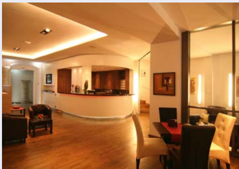
Einladend – das Altstadthotel Arch

Das Altstadthotel Arch befindet sich in einem der schönsten Patrizierhäuser Regensburgs im Herzen der Altstadt. Es zeichnet sich besonders durch Individualität und Verbundenheit mit der Stadt aus. Jedes Zimmer im Hotel wurde nach einem Gassennamen der Regensburger Altstadt benannt. Die Zimmer sind jeweils mit Klimaanlage, WLAN, kostenfreiem Kabel-TV mit Sky-Kanälen, Zimmersafe, Telefon, WC, Dusche oder Badewanne, Fön und Kosmetikspiegel ausgestattet.