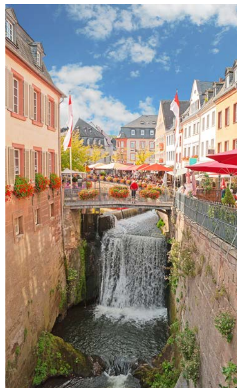
Saarburgs „Wasserfall“ mitten in der Stadt