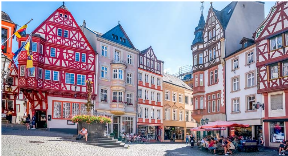
Marktplatz in Bernkastel-Kues

Sie einzigartigen Zeugnissen einer spannenden Vergangenheit. Am späten Abend erreichen Sie bereits Saarburg.