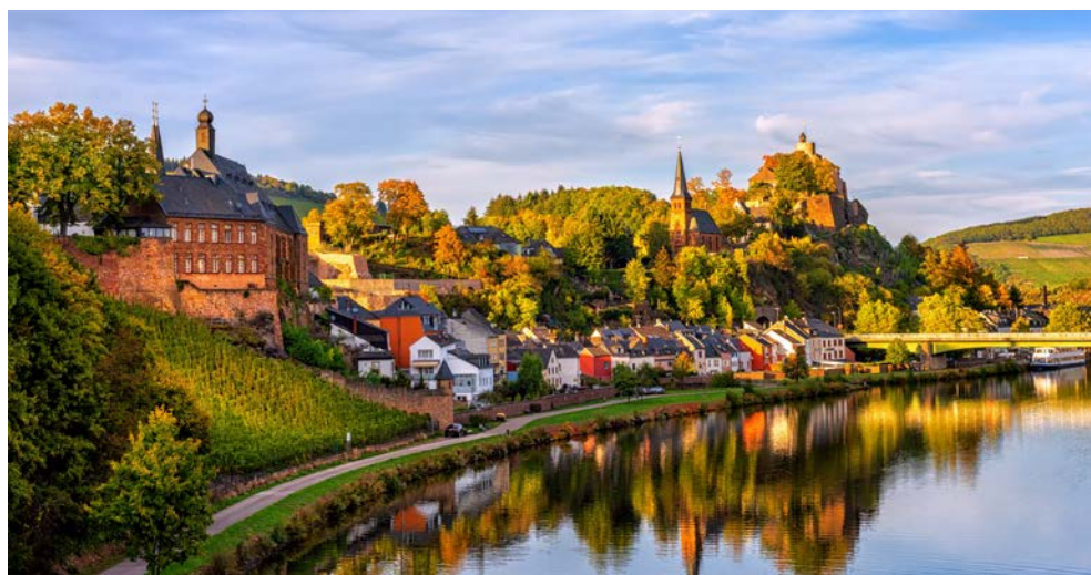
Ob im Sommer oder Herbst, Mosel und Saar bieten wunderschöne Impressionen

Ihre Tage starten mit einem reichhaltigen Frühstücksbuffet, am Mittag erwartet Sie ein mehrgängiges Mittagessen und abends verwöhnen wir Sie mit genussvollen 4-Gang-Menüs. Mittag- und Abendessen werden an Ihrem Platz im Restaurant serviert. Darüber hinaus werden Sie, je nach Tagesablauf und Ausflügen, mit Kaffee und Kuchen am Nachmittag und einem Mitternachtssnack verwöhnt (Bitte informieren Sie uns frühzeitig über Nahrungsunverträglichkeiten bzw. ggf. Diäten oder vegetarische Kost). Darüber hinaus bieten wir Ihnen Getränke in einem umfangreichen COMPASS-All-Inclusive-Getränkepaket an. Es beinhaltet die Hausweine, Bier vom Fass, ausgewählte Flaschenbiere, alkoholfreies Bier, Softdrinks wie Cola, Limonade, Mineralwasser, Säfte sowie Kaffee und Tee. Jede Flussreise beinhaltet einen Kapitänssektempfang und ein Kapitäns-Dinner mit festlichem Menü.