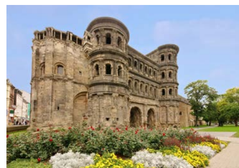
Porta Nigra in Trier