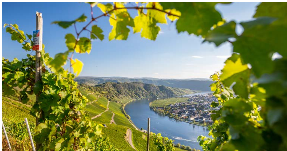
Mosel + Wein = perfektes Duo

Nach dem Frühstück steht der Tag ganz im Zeichen der Römer. Von diesen als „Augusta Treverorum“ gegründet, ist Trier mit seiner 2000-jährigen Geschichte eine der ältesten Städte Deutschlands. Hier begegnen